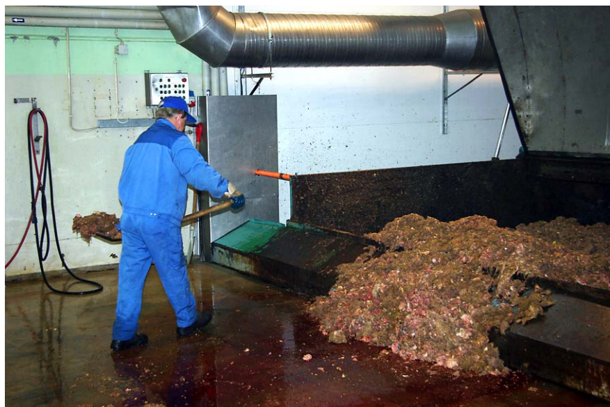
Rakvere Lihakombinaadist saabus järjekordne laadung tapajäätmeid

18. AS Rakvere Lihakombinaat, kellele lihatöötajatest ainukesena on luba käidelda 2. kategooria jäätmeid, kasutab oma jäätmetsehhi vähe ja ostab käitlemisteenuse põhiosas väljast. Näiteks ostis AS Rakvere Lihakombinaat 2006. aastal LJK ASilt teenust koguses 1661 t. Kui lihakombinaat eraldaks sellest 1. kategooria jäätmed, võiks ta ülejäänud tapajäätmed ettevõttes ise töödelda. Kuna kombinaat seda ei tee, siis võib arvata, et loomsete jäätmete käitlemine ei ole erasektorile tulus.