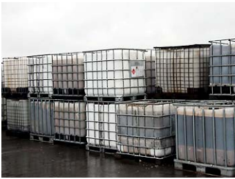
Tehnilise rasva konteinerid ootavad ostjat

26. Kui palju muid põllumajandusloomi (hobused, sead) jääb käitlemata, ei ole võimalik registri andmete põhjal ütelda, kuna andmekogudes andmed puuduvad või ei ole need käitlemise seisukohalt analüüsitavad (vt ka järgmine peatükk lk 12).