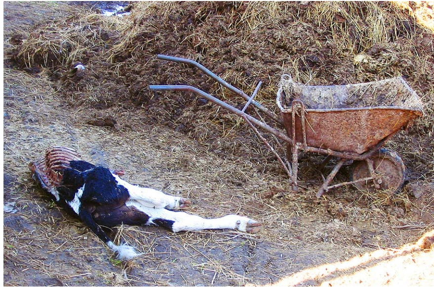
Enne käitlemisele saatmist on korjust tabanud röövloomade rünnak

loomseid kõrvalsaaduseid ei transporditud nõuetekohaselt. Kõigil nimetatud juhtumitel karistati rikkujaid rahatrahviga.