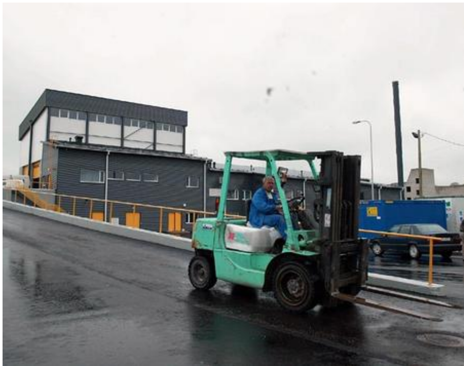
Loomsete Jäätmete Käitlemise ASile kuuluv tehase Väike-Maarjas

7. Loomsete jäätmete käitlemise nõuete täitmiseks asutas Vabariigi Valitsus 2001. aastal Loomsete Jäätmete Käitlemise ASi, mille kõik aktsiad kuuluvad riigile. ASi põhikirjaliseks tegevusalaks on loomsete jäätmete kogumine ja kahjutustamine.