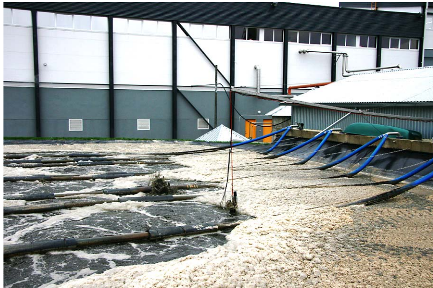
LJK ASi biopuhasti