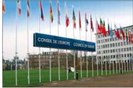
Euroopa Nõukogu hoone Strasbourgis

Eesti on Euroopa Nõukogu liige 14. maist 1993.