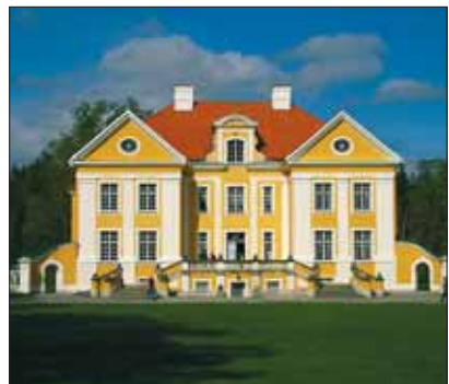
Palmse mõis – üks kaunimaid mõisahooned Eestis