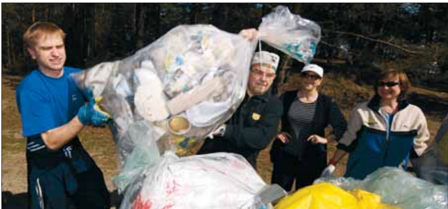
Koristuspäev „Teeme ära 2008”

Osalusveebis www.osale.ee on igal inimesel võimalik esitada valitsusele ettepanekuid, koguda allkirju kodanikualgatuse toetuseks, avaldada arvamust valitsuse eelnõude kohta.