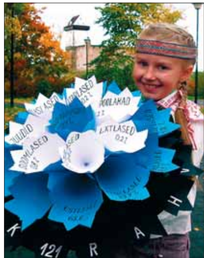
Töö fotokonkursilt „Üks riik – 121 rahvust“

Eesti kuulub rahvaarvu poolest maailma väiksemate riikide hulka.