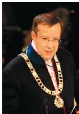
Toomas Hendrik Ilves

Pärast Eesti iseseisvuse taastamist on Eesti presidendid olnud aastail 1992–2001 Lennart Meri ja aastail 2001–2006 Arnold Rüütel. Alates 2006. aastast on Eesti president Toomas Hendrik Ilves.