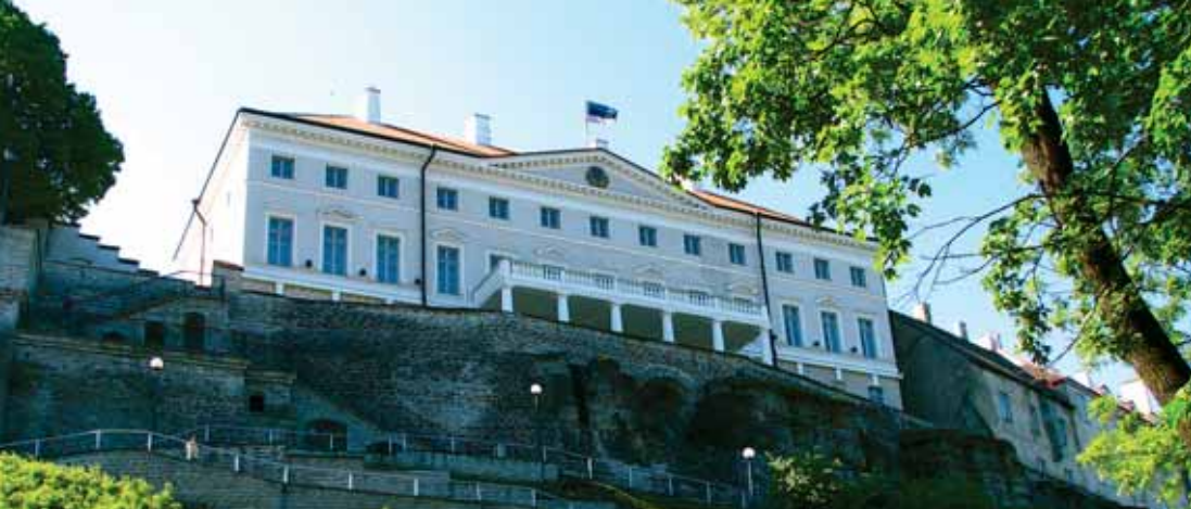
Eesti valitsuse residents Stenbocki maja