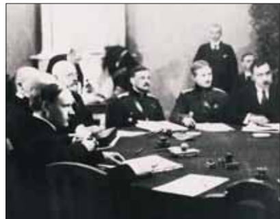
Rahuläbirääkimised Tartus 1920. aastal

2. veebruaril 1920 sõlmisid Eesti Vabariik ja Nõukogude Venemaa Tartu rahulepingu . Mõlemad riigid tunnustasid teineteise suveräänsust.