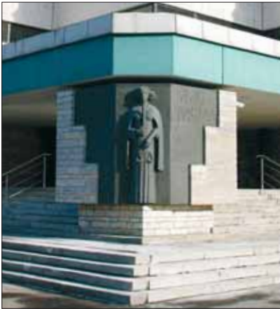
Harju maakohtu Liivalaia kohtumaja

Kohus on Eestis ainus organ, mis mõistab õigust. See tähendab, et lõplikult otsustab kõik vaidlusküsimused kohus. Kohtus on võimalik vaidlustada ka ametniku otsus. Kõigil juhtudel, kui inimese õigusi on rikutud, saab lõpliku otsuse tüliküsimuses langetada kohus.