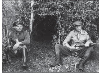
Metsavennad oma punkri ees

Maa oli kogu rahva omandiks kuulutatud juba 1940. aastal, kuid talumajapidamised jäid Eestis siis alles. Jõukamatele talupidajatele kehtestati kõrged riiginormid ja maksud. Alles 1949. aasta küüditamine hirmutas suurema osa talupidajatest kolhoosidesse , mis tõi kaasa põllumajanduse allakäigu. Maaelu hakkas jälle edenema kümnekonna aasta pärast. Teise maailmasõja järel jätkus Eestis relvastatud vastupanuliikumine – metsavendlus . See suudeti maha suruda alles 1940. aastate lõpuks, kui oli küüditatud suur osa metsavendade toetajatest. Arreteeritud ja küüditatud inimesed hakkasid Eestisse tagasi pöörduma pärast Stalini surma 1953. aastal. Tagasitulijaid oli umbes 30 000.