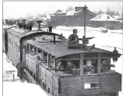
Soomusrong Vabadussõja päevil

Vabadussõjas (1918–1920) võitles Eesti sõjavägi nii Punaarmee kui ka Läti territooriumil tegutsevate saksa väekoondiste – Rauddiviisi ja kohalikest baltisakslastest moodustatud Landeswehr 'iga. Eesti sõjaväe ülemjuhataja Vabadussõjas oli kindral Johan Laidoner. Eestit toetasid Briti laevastik ning Soome, Taani ja Rootsi vabatahtlikud. Eesti ülemjuhatause all võitlesid eestlaste kõrval ka baltisakslaste, venelaste, lätlaste ja ingerlaste rahvuslikud pataljonid. 1919. aasta kevadeks tõrjuti Punaarmee Eesti pinnalt välja. Seejärel peeti positsioonisõda Narva rindel ja Kagu-Eestis.