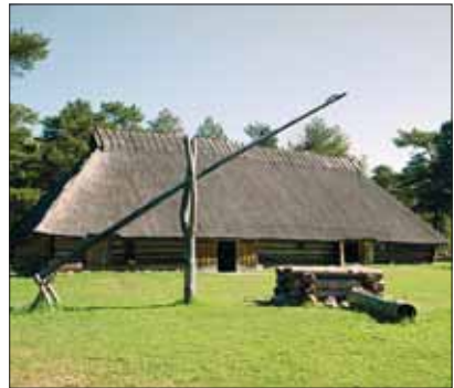
Eestlaste traditsiooniline elumaja – rehelamu