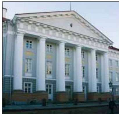
Tartu Ülikooli peahoone

Pärast gümnaasiumi on võimalik edasi õppida ülikoolis , rakenduskõrgkoolis või kutsekoolis. Tuntuim Eestis tegutsev ülikool on Tartu Ülikool, mis asutati juba 1632. aastal.