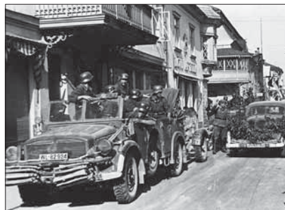
Saksa vägede sisenemine Pärnusse 1941

1941. aasta 22. juunil puhkes sõda Saksamaa ja Nõukogude Liidu vahel. Saksa armee jõudis juuli alguses Eestisse. Eestis oodati sakslaste saabumist, et pääseda bolševike terrori alt. Lisaks lootsid paljud, et sakslased toetavad Eesti iseseisvuse taastamist. Tuhanded mehed võitlesid selle nimel metsavendadena või astusid Saksa sõjaväkke. Sakslased Eesti riigi iseseisvust ei taastanud. Algasid natslikud repressioonid. Eestis hukati 8000 inimest, nende hulgas umbes tuhat Eesti juuti ja tuhat Eesti venelast. Mitu tuhat inimest saadeti