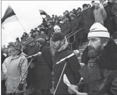
Rahvarinde poolt korraldatud miiting Linnahalli juures 1988

1985. aastal sai Nõukogude Liidu Kommunistliku Partei keskkomitee peasekretäriks Mihhail Gorbatšov, kelle eestvõttel algas perestroika ja glasnost . Üks esimesi sellest ajendatud üritusi Eestis oli „fosforiidisõda”. Nõukogude Liidu väetisetööstuse ministeerium kavandas Lääne-Viru-