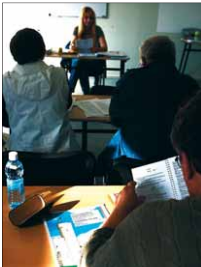
Kursus kodakondsuse taotlejatele

Kodakondsuse taotlejatel, kes sooritavad nii keeleeksami kui ka seaduste tundmise eksami, on õigus taotleda eksamikeskuselt ühekordset hüvitist eesti keele õppele kulunud õppemaksu eest. Taotlus tuleb esitada kolme kuu jooksul pärast viimase eksami sooritamist.