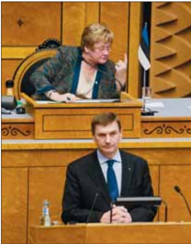
Riigikogu esimees Ene Ergma ja peaminister Andrus Ansip Riigikogu saalis