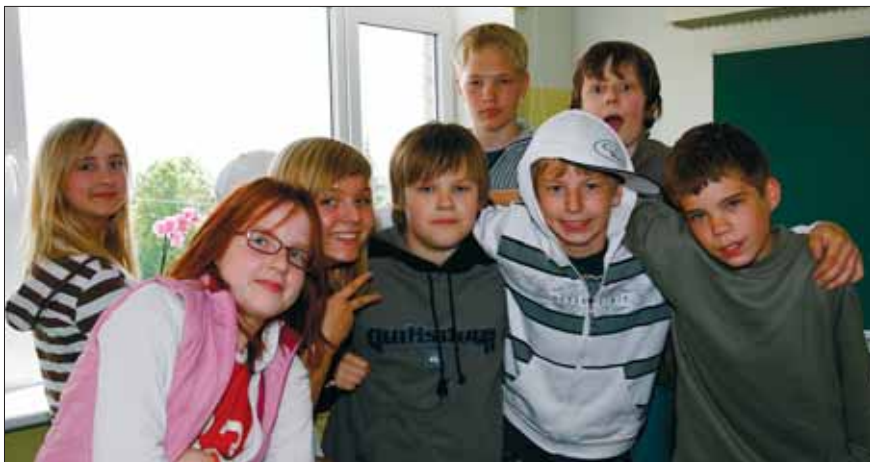
Kõigil on õigus ja kohustus haridusele

omavalitsusi võivad ajaloolisest traditsioonist lähtudes moodustada saksa, vene, rootsi ja juudi vähemusrahvusest isikud. Lisaks nendest vähemusrahvustest isikud, kelle arv Eestis on üle 3000. Tänapäevaks on oma kultuuriautonomia õiguse teostanud soomlased ja rootslased. Riigilt on toetust saanud ka Peipsi ääres elavad vanausulised. Eestis töötab 18 eri rahvaste pühapäevakooli ning rohkem kui 200 kultuuriseltsi. Vähemusrahvuse kultuuriomavalitsuse põhieesmärgid on korraldada emakeele õpet ja kultuuriüritusi, moodustada rahvuslikke kultuuriasutusi jne.