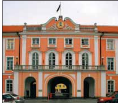
Riigikogu kogunemispaiik – Toompea loss

Seadusi saab vastu võtta ka rahvahääletusel. Rahvahääletuse korraldamise saab otsustada üksnes Riigikogu. Rahvahääletuse otsus on Riigikogule, valitsusele ning teistele riigijorganitele kohustuslik. Otsus on vastu võetud, kui selle poolt on rohkem kui pooled hääletanud inimestest.