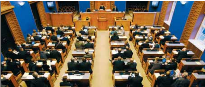
Riigikogu täiskogu istung

Kõik Riigikogu liikmed kuuluvad komisjonidesse . Riigikogu komisjon on töörühm, kus arutatakse ühe valdkonna piires esitatud seaduseelnõusid. Alatised komisjonid on näiteks väliskomisjon, kultuurikomisjon, rahanduskomisjon, keskkonnakomisjon jne. Iga komisjon arutab oma valdkonna probleeme ja seaduseelnõusid. Niimoodi saab parlamendi liikmete koor-