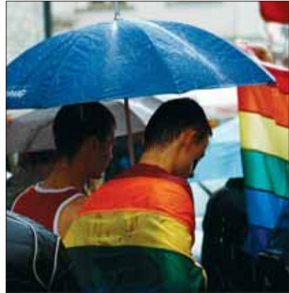
Eestis on igaühel õigus tutvustada oma vaateid

tutvustada sõnas, pildis või muul viisil. Mõtted võib kirja panna raamatusse või kirjutada artikli, kommenteerida võib ka teiste väljaütlemisi internetis. Seda tehes tuleb silmas pidada teiste inimeste õigusi ja vabadusi ning hoida avalikku korda. Riigil on kohustus tagada igaühe õiguste ja vabaduste kaitse, tõrjuda rassilist või poliitilist vihkamist.