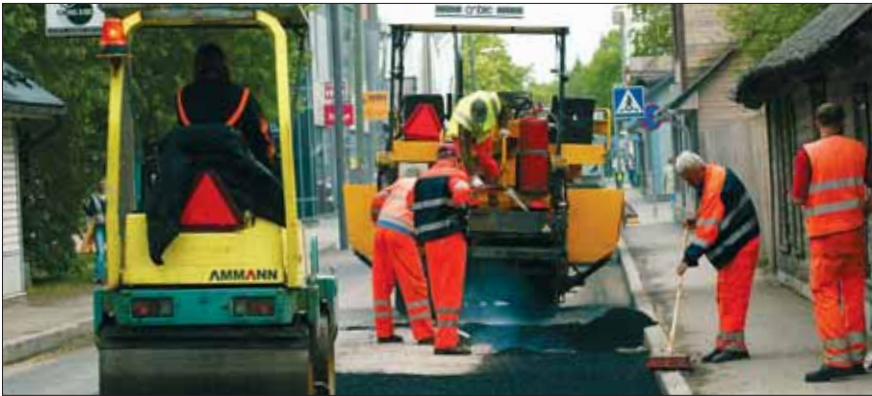
Teede korrashoid on kohaliku omavalitsuse ülesanne

Kohalikul omavalitsusel on oma ülesannete täitmiseks iseseisev eelarve . Eelarveraha saadakse üksikisiku tulumaksust ja maamaksust, samuti riigi-eelarvest. Valla- või linnavolikogu võib kehtestada ka kohalikke makse .