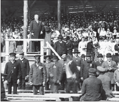
Laulupidu Tartus 19. sajandil

1890. aastaid nimetatakse Eesti ajaloos venestamise ajaks . Balti kubermangudes kehtestati Vene kohtusüsteem ja linnaseadused. Maapiirkondades säilis baltisaksa mõisnike võimküll Esimese maailmasõjani. Asjaajamise keeleks sai siiski vene keel ning venekeelseks muudeti ka haridus algkoolist ülikoolini.