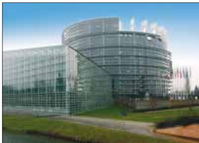
Euroopa Parlamendihoone Strasbourgis

Euroopa Parlamenti valitakse saadikud igast riigist riigi elanike arvu alusel. Euroopa Parlamendi valimised toimuvad iga viie aasta tagant. Parlamendi