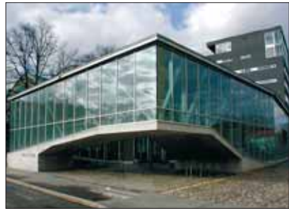
Okupatsioonide muuseumi ekspositsioon kajastab aastaid 1940–1991, mil Eestit okupeerisid vaheldumisi Nõukogude Liit ja Saksamaa

Septembris 1939 puhkes Teine maailmasõda. Juunis 1940 alistas Saksamaa Prantsusmaa. Samal ajal esitas Nõukogude Liit Balti riikidele ultimaatumid. Neis ähvardati sõjalise jõuga, nõuti täiendavate Nõukogude vägede lubamist riiki ning valitsuse vahetust. Balti riigid, millel polnud lootust saada välisabi, võtsid ultimaatumid vastu. 17. juunil 1940 okupeeris Punaarmee Eesti. Nõukogude Liidu esindajad määrasid ametisse uue valitsuse ja parlamendi, mis taotlesid Eesti liitmist Nõukogude Liiduga. Nõukogude Liidu ülemnõukogu arvas Eesti Nõukogude Liidu koosseisu 6. augustil 1940.