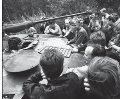
1991. aasta riigipöördekatse ajal Eestisse saadetud Nõukogude armee tank Tallinna lähistel Kloostrimetsas

Riigipöördekatse Moskvas 1991. aasta augustis tõi kaasa iseseisvuse lõpliku taastamise . Pihkvast Tallinna saadetud õhudesant-diviisi üksuste kohalolekule vaatamata otsustasid Eesti ülemnõukogu ja Eesti Kongress 20. augustil 1991 taastada Eesti iseseisvuse. Seda otsust tunnustasid kiiresti lääne-riigid ja Venemaa.