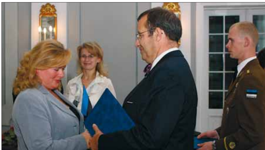
Kodakondsustunnistuste pidulik kätteandmine Kadrioru kunstimuuseumis 30. septembril 2008

Seejärel saadetakse dokumendid valitsusele, mis otsustab kodakondsuse andmise. Kui valitsuse otsus on positiivne, vormistatakse uuele kodanikule kodakondsustunnistus, mis antakse kätte pidulikul tseremoonial. Seejärel saab kodanik taotleda Eesti kodaniku passi ja isikutunnistust ehk ID-kaarti.