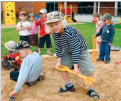
Kohalikud omavalitsused peavad üleval lasteaedu

Valla ja linna ülesanne on näiteks korraldada eakate inimeste hoolekan- net, veevarustust, prügimajandust, teede ja tänavate korrashoidu jne. Samuti peab kohalik omavalitsus üleval lasteaeda, kooli, raamatukogu ja rahvamaja.