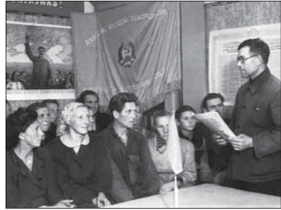
Kolhoosiesimees koosolekul kõnelemas

sõjaväes, kui ka suur hulk „Nõukogude-vastast elementi”. Jätkusid ka küüditamised : 1945. aastal viidi Siberisse mõnisada Eestisse jäänud sakslast, 1949. aastal küüditati üle 20 000 inimese, peamiselt talupojad, 1951. aasta alguses Jehoova tunnistajad.