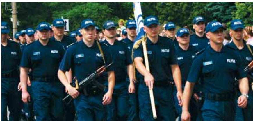
Õigus töötada politseinikuna on ainult Eesti kodanikul

Eesti riik kaitseb oma kodanike õigusi välisriikides . Eesti saatkond aitab Eestisse tagasi pöörduda kodanikul, kes on välismaal reisisid või elades hätta sattunud. Vajaduse korral aitab saatkond vormistada uue reisidokumendi, hankida kojusõidu piletit, korraldada arstiabi jne.