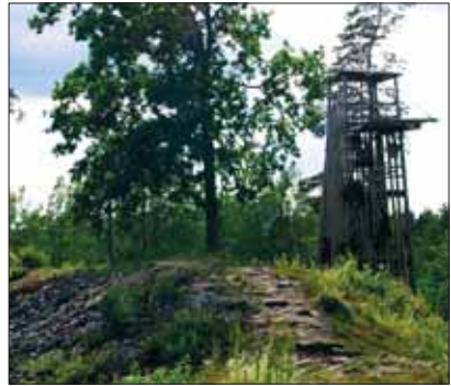
Varbola linnuse varemud koos piiramistorniga

Maaomanikud (mõisnikud) olid enamasti Saksamaalt tulnud ristirüütelite, sõjameeste, ametnike ja kaupmeeste järeltulijad. Koos Saksa päritolu linnakodanike ja vaimlikega moodustasid nad kohaliku ülemkihi, keda nimetati baltisakslasteks. Neile kuulus kohalik võim ja kohalik ametlik keel oli saksa keel.