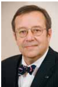
Vabariigi President Toomas Hendrik Ilves

Eesti riigi sõnum saab seetõttu olla ühene: me toetame iga siin elava mittekodaniku tahet saada Eesti kodakondsus ja liituda täielikult Eesti ühiskonnaga. See on privileeg, mis kuulub vaid Eesti Vabariigi kodanikule.