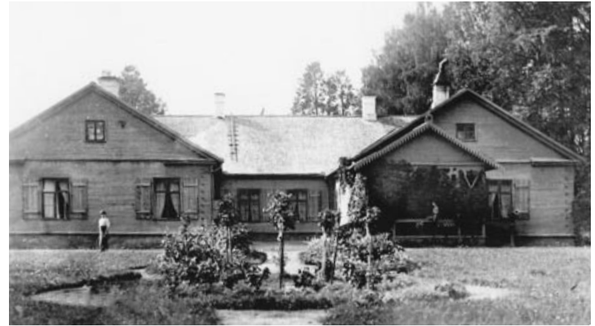
Kiidjärve mõis 1910. aastal.

Kuna põllumaad oli Kiidjärvel vähe, pandi rõhku kohaliku väike-