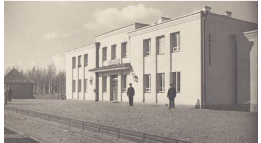
Kiidjärve jaamahoone.

Tänapäeval aitab Kiidjärve kultuuri- ja vaimuelu ärksana hoida külakeskus koos raamatukoguga ning aktiivselt tegutsev Kiidjärve Küla Selts. Loodusteadlikkuse edendamine ehk loodus- ja keskkonnaharidus on põhitöök RMK Kiidjärve looduskeskuses. Samas tegutsev teabepunkt annab infot piirkonna looduse ja metsapuhkuse võimaluste kohta.