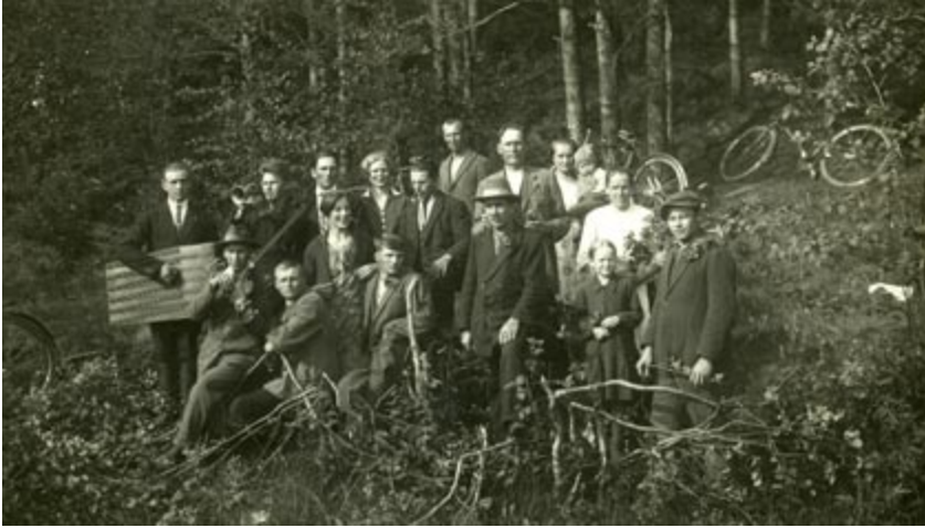
Kiidjärve külanõored 1928. aasta jaanipäeval.

Oluliseks sündmuseks külaelu edenemisel sai Tartu–Petseri raudtee valmimine 1931. aastal. Ilus kahekordne jaamahoone, haruraudtee ja laadimisplatvorm andsid külale juurde majandamisvõimalusi ja väarikust. Kiidjärve külas oli sel ajal neli kauplust.