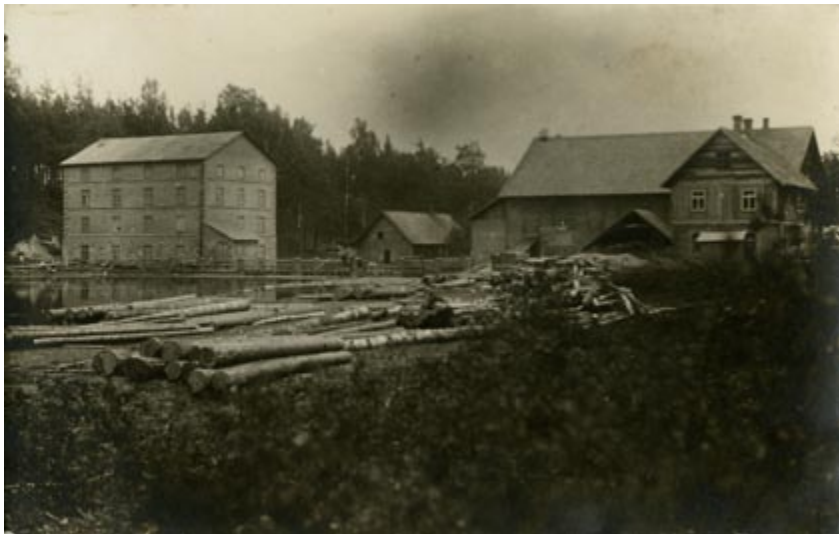
Kiidjärve veski 1929. aastal.