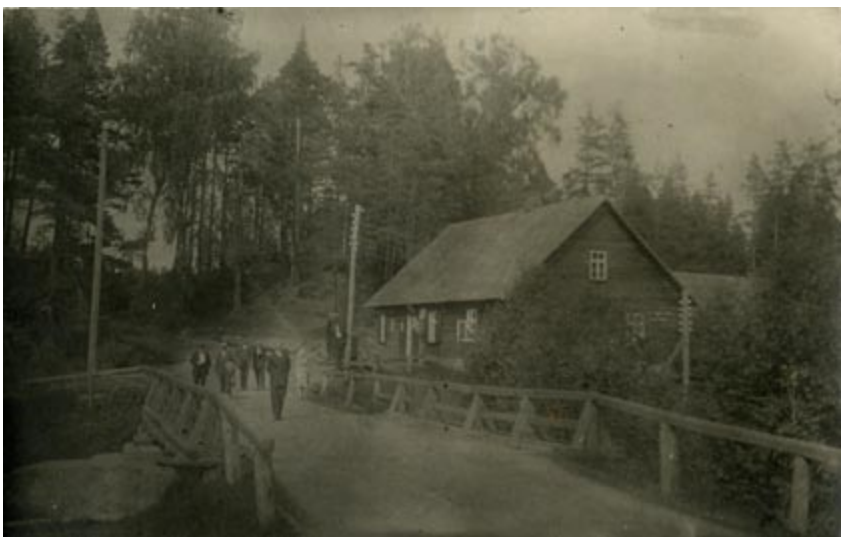
Suvitajad Kassioru sillal 16. juunil 1929. aastal.

RMK Kiidjärve-Kooraste puhkeala asub Põlvamaal ja on rikas arheoloogiliste, kultuurilooliste ning looduslike vaatamisväärsuste poolest. Kiidjärve-Kooraste puhkeala jaguneb kaheks osa-alaks: Kiidjärve-Taevaskoja ja Erastvere-Kooraste. Mõlemal alal asub looduskeskus – Kiidjärve looduskeskus puhkeala põhja- ning Erastvere looduskeskus lõunaosas. Kuigi tänapäeval asuvad mõlemad looduskeskused Põlvamaa territooriumil, on Kiidjärve küla ajalooliselt kuulunud Tartumaa ning Erastvere ümbrus Võrumaa alla. Seetõttu vaadeldakse ka käesolevas puhkeala pärandkultuuri tutvustavas trükises neid eraldi.