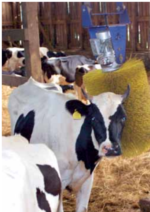
Automaatselt käivituvad harjad Mätiku talu laudas

Laudad, sulud, seadmed ja riistad peavad olema puhastatud ja desinfitseeritud, et vältida nakkuste levikut ning haigusekandjate tekkimist. Kasutada võib üksnes määruse (EÜ) nr 889/2008 VII lisas loetletud tooteid. Putukate ja muude kahjurite hävitamiseks võib kasutada sama määruse II lisas loetletud tooteid. Rodentitsiide võib kasutada ainult lõksudes.