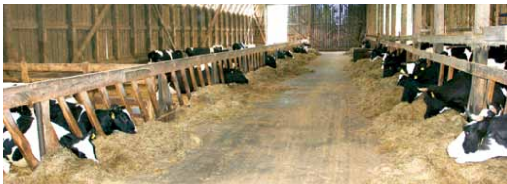
Vabapidamislaud Pärnumaal Mätiku talus

Kui ettevõttes alustatakse mahepõllumajanduslikku veisekasvatust koos mahepõllumajandusliku taimekasvatusega, siis saab piima mahesaadusena müüa kahe aasta pärast. Kui üleminekut mahepiimatootmisele alustatakse ettevõttes, kus taimekasvatus on üleminekuaja mahepõllumajandusele läbinud, tuleb selleks, et piima saaks mahesaadusena müüa, loomi eelnevalt pidada mahepõllumajanduse nõuete kohaselt vähemalt 6 kuud.