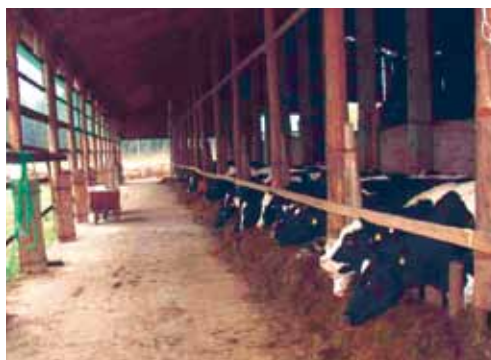
Vabapidamislaud Viljandimaal Pajumäe talus