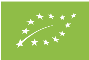
EE-ÖKO-02 Eesti põllumajandus

Joonis 2. Euroopa Liidu mahepõllumajandusliku tootmise logo koos kohustuslike tähistega, mis peavad olema logoga samal vaateväljal (toote ühel küljel): järelevalveasutuse (VTA) koodnumber ja päritolutähis