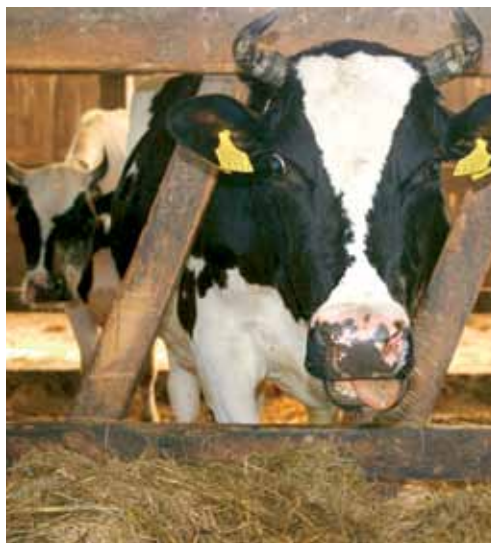
Ka mahetootmises on levinuim tõug eesti holstein

Tavaliselt jääb lehm kinni 1,5–2 kuud enne järgmist poegimist. Kui lehm ise kinni ei jää, tuleb ta söötmise ja jootmise piiramisega kinni jätta. Ratsioonist jäetakse ära jõusöödad, juurvili, piirata tuleb ka silo söötmist või asendada see heinaga. Levinud on kinnijätmine, kus lüpstakse üks kord päevas, siis üle päeva ja nii edasi, kuni piimatoodang väheneb nii palju, et saab lüpsi ära jätta. Teine võimalus on, et lüpsmine jäetakse ära päevapealt ja enam udarat ei puudutata. Küll aga jälgitakse, et loomal ei tekiks põletiku tugevaid tunnuseid. Esimesel juhul hoitakse lehma pikaajaliselt stressis, teisel juhul on loomal küll suurem stress, aga see kestab tunduvalt lühemat aega. Päevapealt kinnijätmine on vähem