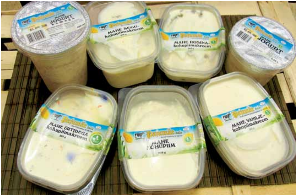
Pajumäe talu toodang on ökopoodides minev kaup