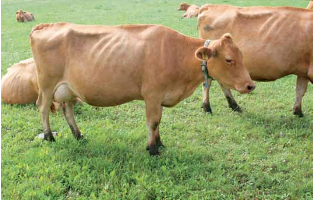
Eesti maakarja tõugu veis

Eesti punast tõugu veised on välja kujunenud kohaliku tõu vältava ristamise teel angli ja taani punase tõuga. Viimase kümne aasta jooksul on eesti punase karja aretuses kasutusele võetud mitu eri tõugu, nagu sviitsi, rootsi punane, norra punane, ääršir ja punasekirju holstein, mistõttu punase lehma värvus varieerub helepruunist kuni punase-valgekirjuni. Põhiliseks aretusmaterjaliks on ikkagi jäänud taani punane tõug. Selle tulemusel on aretatud uut tüüpi eesti punane tõug, kellel on hea piimajõudlus, tugevad jalad, hea tervis ja tüüp. Piimatoodang on eesti punasel karjal veidi väiksem kui Eesti holsteinil, kuid rasva- ja valgusisaldus piimas pisut suurem. Samuti on eesti punasel karjal tugevam tervis ja paremad viljakuse näitajad. Seetõttu on ta ka mahe tootmisse hästi sobiv tõug.