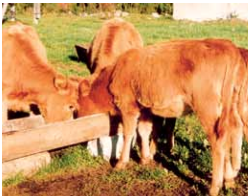
Eesti maakarja tõugu vasikad

suurel määral põhisöötaiteväärtusest ja kvaliteedist. Et head silo suudavad veised rohkem süüa, siis on selle arvelt võimalik jõusööda kogust ja piima omahinda vähendada. Kui mahetalus kasvatatakse juurvilja või kartulit, siis võib 1 kg jõusööda asendada 3–4 kg kartuli või 5–6 kg söödapeediga. Tabelis 10 toodud talvise näidisratsiooni puhul on kasutatud hea kvaliteedi ja toiteväärtusega (metaboliseeruvat energiat 10,4 MJ ja toorproteiini 158 g/kg kuivaines) põldheinasilo. Koostatud ratsiooni puhul toodetakse umbes 15–16 kg piima silo ja 8–9 kg piima jõusööda arvelt.