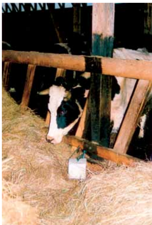
Kui lakukivi jaoks pole spetsiaalset hoidjat, kinnitatakse see jämeda nõõriga