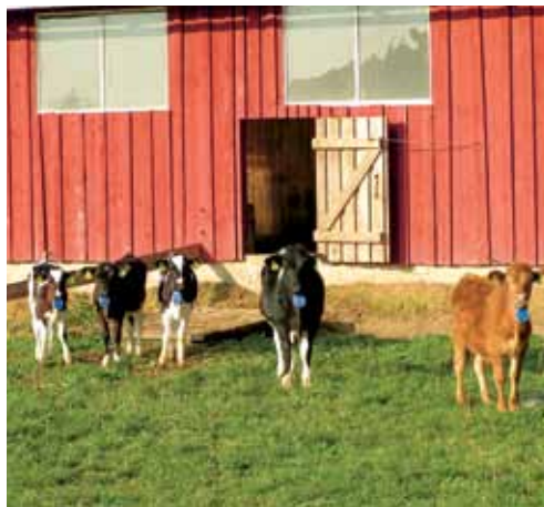
Noorloomad Pajumäe talus

Mineraalsöötasid ja mikroelemente on soovitatav sööta koos põhisöötadega.