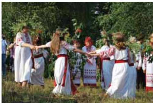
Ivana Kupala püha.

Ööl vastu 7. juulit tähistavad ukrainlased iidsetest aegadest Ivana Kupala püha, see langeb kokku Ristija Johannese pühaga. Tütarlapsed punuvad sel päeval põllulilledest pärgi, viskavad need õhtul vette ja jälgivad tähelepanelikult nende liikumist. Kui pärg ujub kenasti, saab tütarlaps aasta jooksul mehele; kui pärg keerleb ühe koha peal, pole meheleminekut veel mõnda aega oodata; kui aga pärg ujub kaldale, on sealtkandist peigmeest oodata juba samal ööl. Julgemad otsisid sõnajalaõit, mis avanes legendi