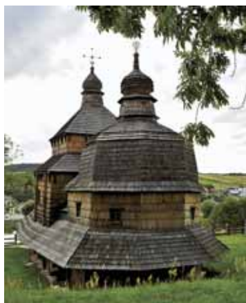
1502. aastal ehitati naelu kasutamata Püha Vaimu kirik.