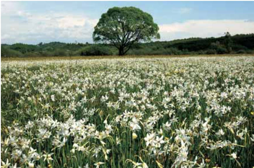
Imeline Nartsisside org.

Karpaatide pöögimetsad on aga kantud UNESCO maailmapärandi nimekirja.