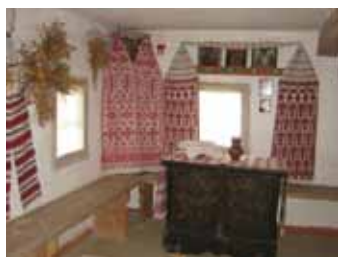
Ukraina maja seestpoolt.