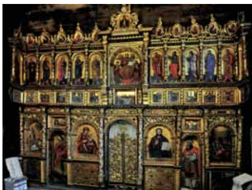
Jumalaema kiriku ikonostaas (Kutõ küla).