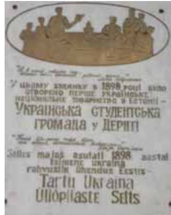
Mälestustahvel Dorpati Ukraina Üliõpilaste Gromaada kohtumisaegs.

Ukraina saatkonna toetusel on paigaldatud mälestustahvel Tartus Tähtvere 16 asuvale majale. Just seal toimusid Dorpati Ukraina Üliõpilaste