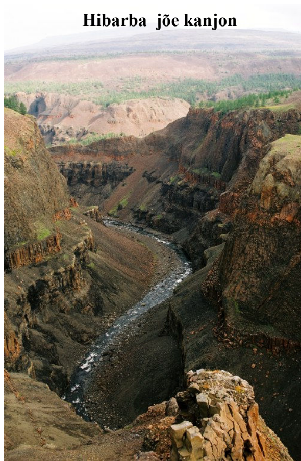
Hibarba jõe kanjon