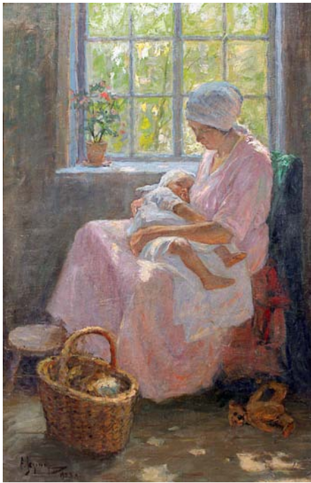
«Emaarmastus» Lõuend, õli. 104,5 x 67,5 cm. 1923. EKM

20. veebruarist 28. aprillini 2013 on Tallinna Vene Muuseumis avatud Andrei Jegorovi maalinäitus.