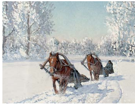
«Talvemaastik hobuste ja regedega» Papp, segatehnika. 28 x 34 cm. USKG