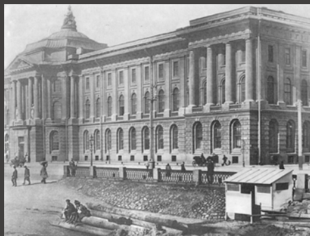
Peterburi Kunstide Akadeemia hoone saajandivahetusel

Ta sündis 20. juunil (3. juulil) 1878. aastal Aruküli külas (praegu Tallinna lähistel Rae vallas asuv Aruküla) moonaka peres. Tema kauged esivanemad olid Tveri talupojad, kes olid siia ümber asustatud Peeter I käsul peale Põhjasõda.