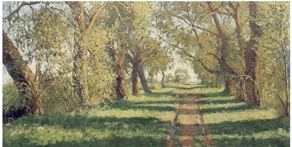
«Allee» · Lõuend, õli. 85 x 104 cm. 1931. TKM

Väljapandud tööde hulgas on ka selliseid, mida pole varem eksponeeritud. Paljudel sellistel töödel ei ole mitte ainult kunstiline, vaid ka ajalooline väärtus. Nagu näiteks metropoliit Aleksanderi (Pauluse) ja kirjanik Ernst Särgava-Petersoni portreed.