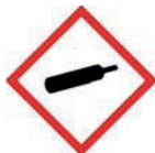
Газ под давлением