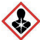
Опасно для здоровья