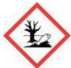
Опасно для окружающей среды