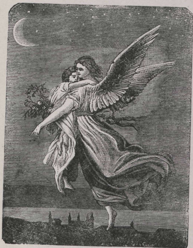
Engel lendab kapsega taewa.