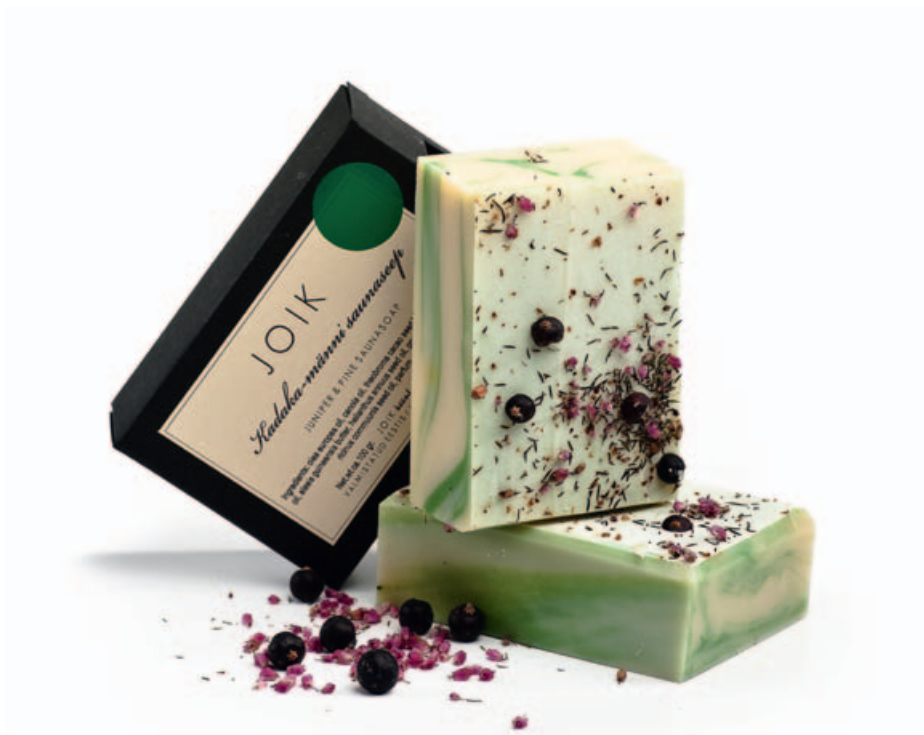
Kadaka-männi saunaseep. JOIK