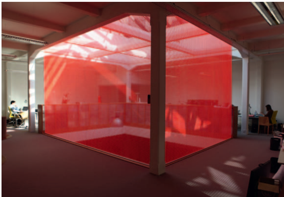
Detail reklaamiagentuuri Graphemes sisekujundusest Lille'is (2012)