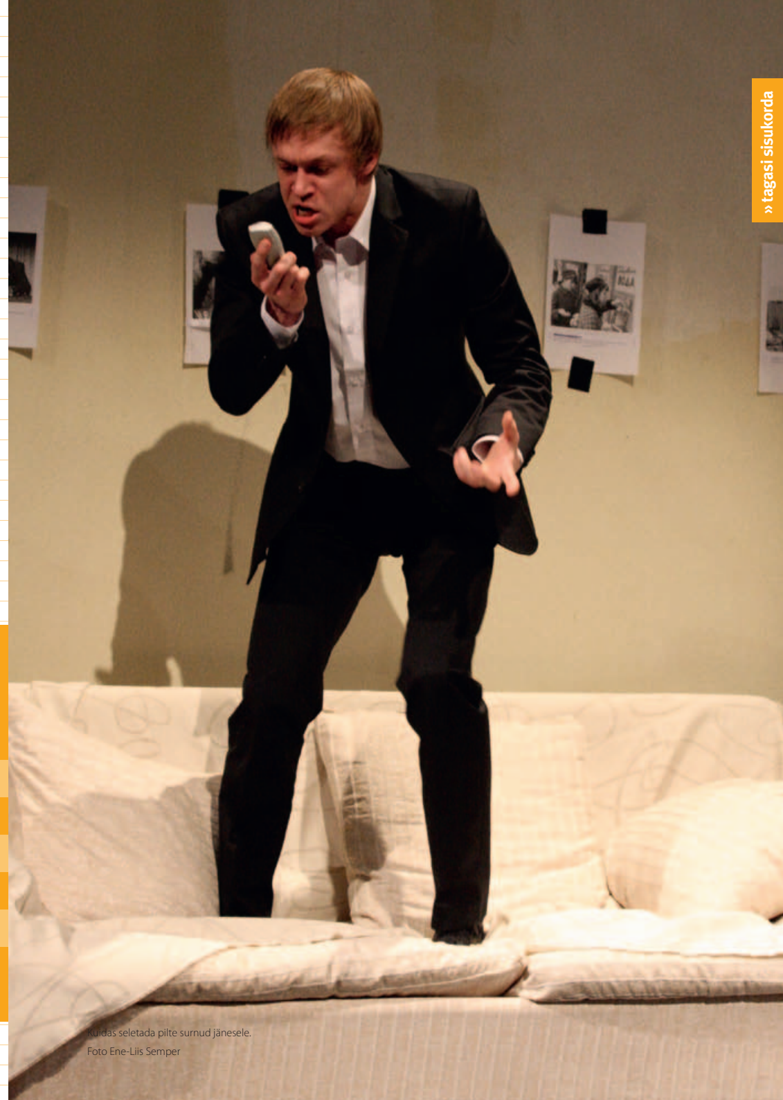
Kuidas seletada pilte surnud jänesele.