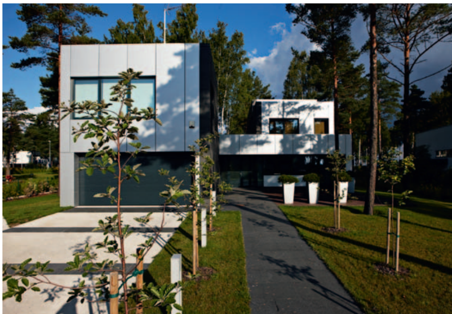
Eramu Tallinnas.