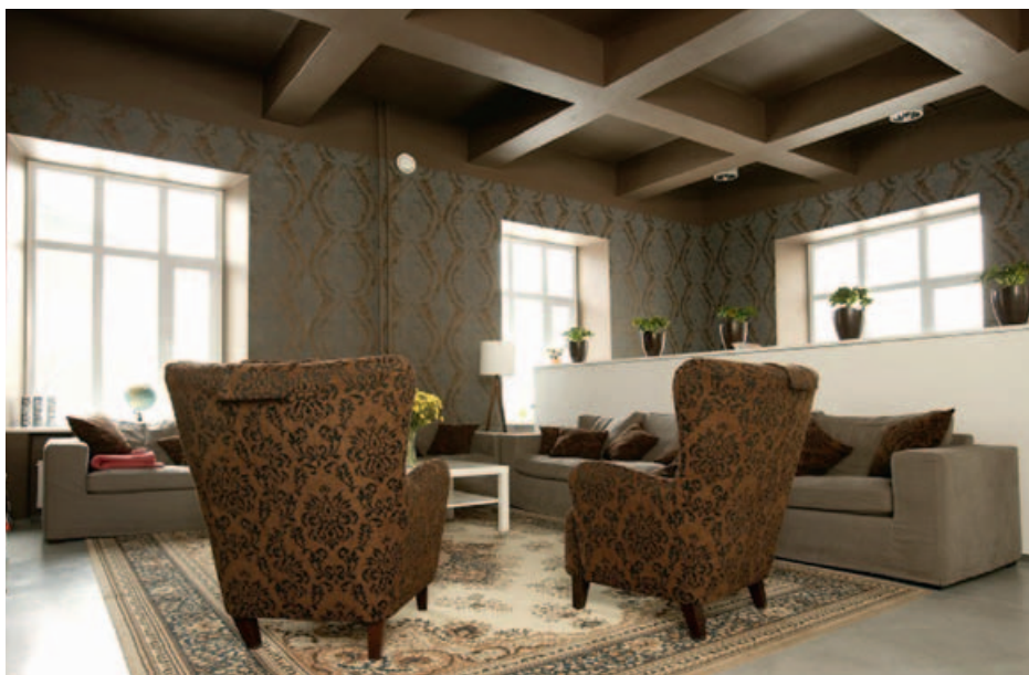
Velvet on veendunud, et töökoht peab olema loovust ergutav