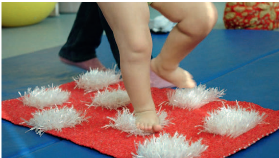
Taktiline vaip – Liis Koort