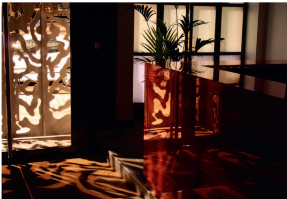
Detail ECV sisekujundusest Bordeaux's (2010)