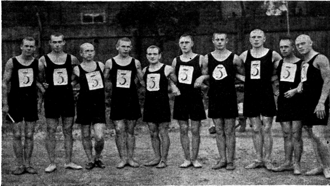
Võitja politseikooli meeskond.

Kuuldavasti tahetakse edaspidi võistlusi korraldada politseikooli ja Tallinna linna politsei meeskondade vahel, nimelt teatejooksus ja murdmaa jooksus 3 kilomeetri peale.