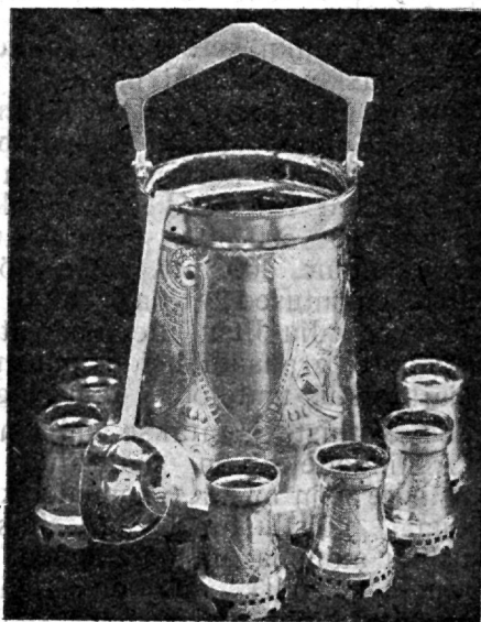
Riigivanema rändav üldauhind Tallinna-Riia politseivahelistel spordivõistlustel.

Sellepärast olgu tervitatud sport, olgu tervitatud väga lugupeetud naabrid-külalised!