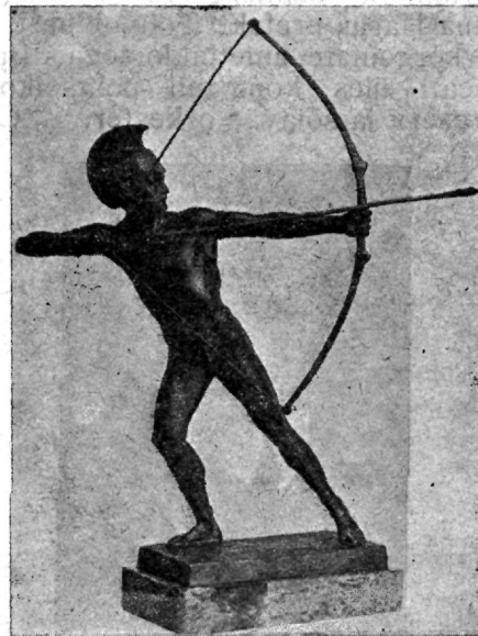
Siseministri auhind võitjale meeskonnale teatejooksus ümber linna 10x500 mtr.