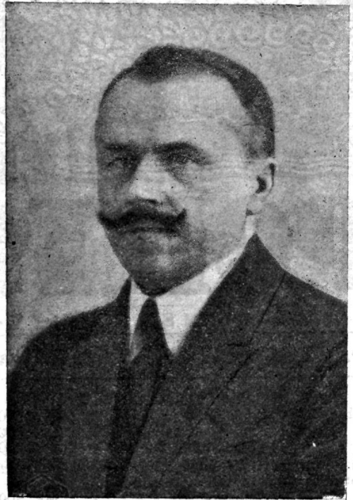
Läti siseminister Laimins.