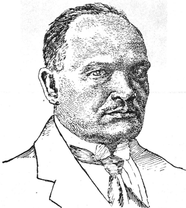
Riigivanem K. Päts.