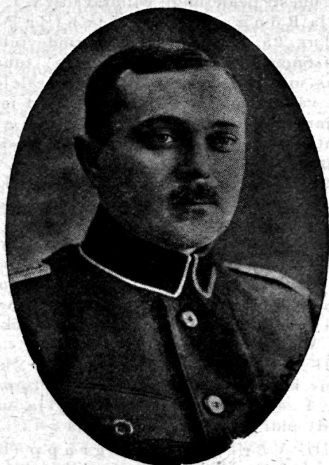
Kolonel Viktor Puskar 2. diviisi ülem Vabadusesõjas.