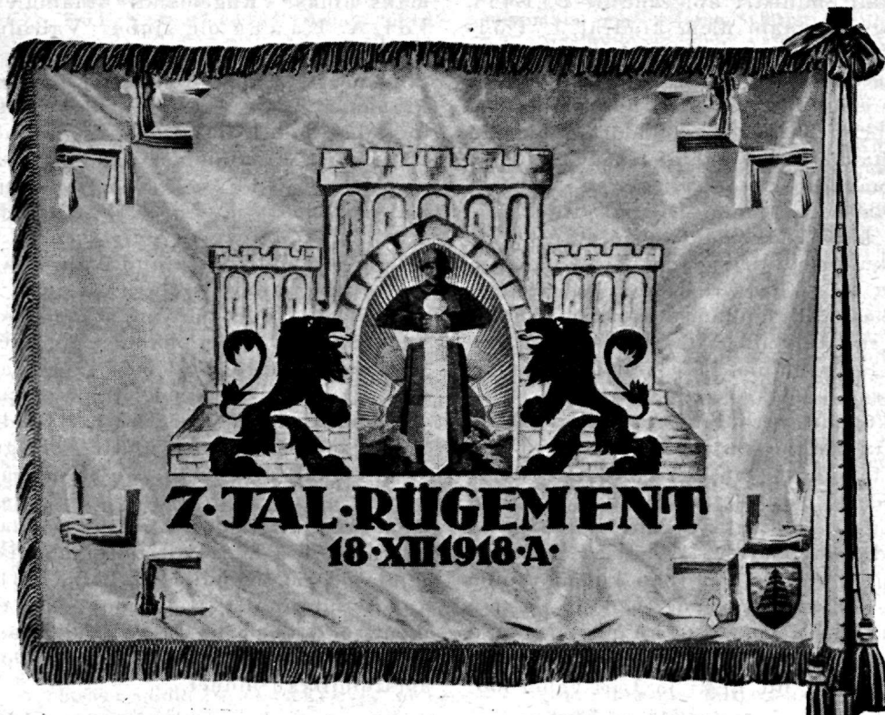
7. jalaväe rügemendi lipp.

gemendi kohta aga teise otsuse: 1921. a. suvel moodustati 7. jalaväe pataljonist uuesti rügement ja asetati vastutuserikkale kohale, kui väeosa, kes oli olnud