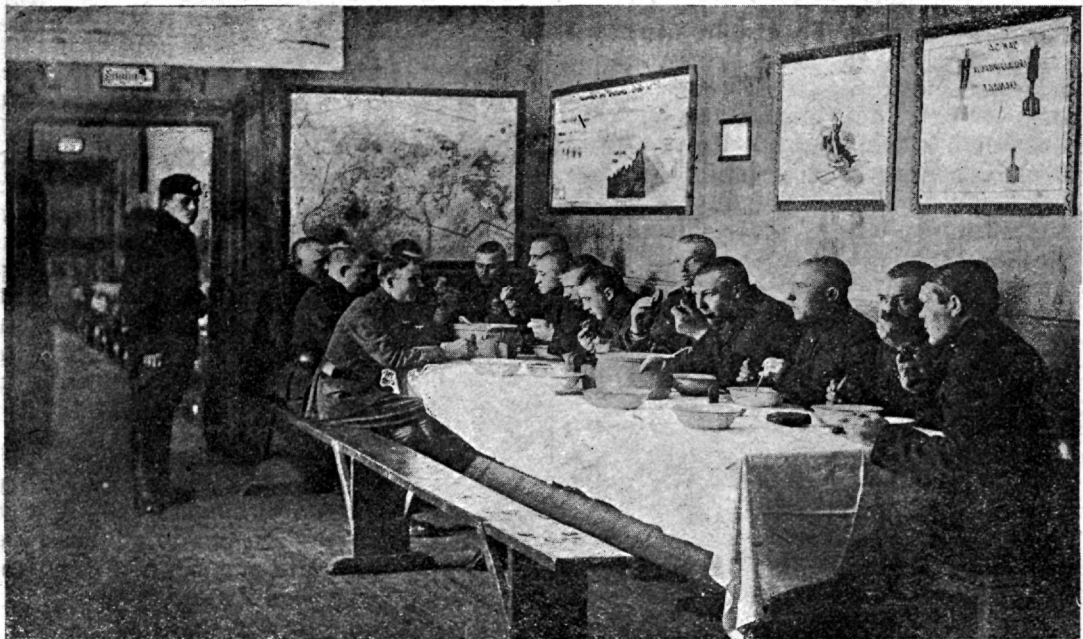
Ühe kompanii söögisaal.

wõeta teenistuse aega ilma palgata, puhkusel ja rawitsusel wiibimise aega üle seaduse ettenähtud normi ning arestis ja wangistuses wiibimise aega üle 3 kuu. Kohtu ehk eeluurimise all olemise tõttu teenistuse kohuste täitmisest eemal olemise aeg wõetakse arwesse pensioni saamisel ainult siis, kui kõrwaldatu kohtu poolt õigeks ehk temale karistus määratakse, mis pensioni õigust ära ei wõta. Sõjawangis wiibimise aeg wõetakse arwesse ainult neil juhtumistel, kus kindlaks tehtud, et wangisattumine sündis täesti wäljapääsematu seisukorra tõttu.