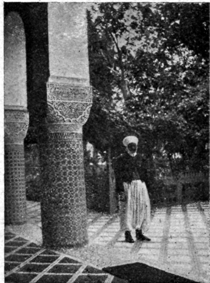
Fezi raiooni ülema kindral de Chambrun'i asukoht.