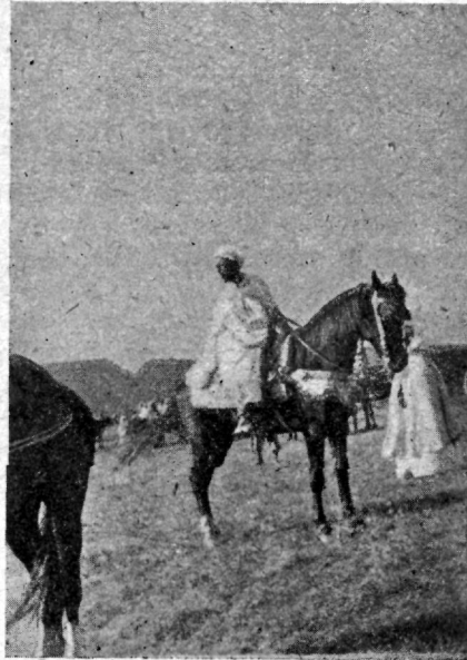
Zaiaani pashaga wäljaõmmeldud sadulus. Sadula massiivsed jalused on kullast.

Suurem osa üksusi koosnewad pärismaalastest. Puht Prantsuse wäeosasid on koguni wähe, nimelt 3 Afrika ja 4 Zuaawide pataljoni. Afrika pataljonid on spetsiaal wäeosa, mida mujal ei tarwitata. Zuaawide pataljonides walmistatakse prantslasi ette eriteenistusteks ja teenistuseks pärismaalaste wäeosades. Otsekohest lahingutähtsust nendel ei ole. Tähtsat osa Marokko operatsioonides etendawad wäljamaalastest koosnewate leegionide pataljonid. Neid on 9. Ülejäänud 27 on Marokko, Alshiiri, Tunisi ja Senegali pärismaalaste pataljonid.