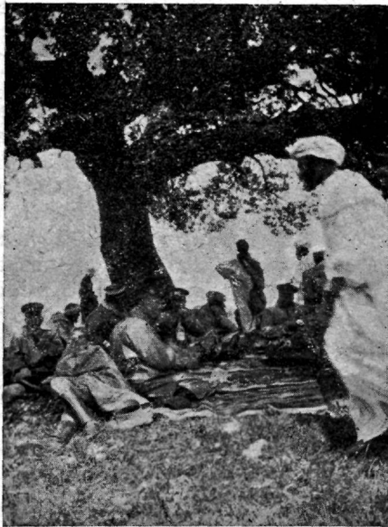
Eine rohelse tamme all Atlasi mägedes, 2000 meetri kõrgusel.