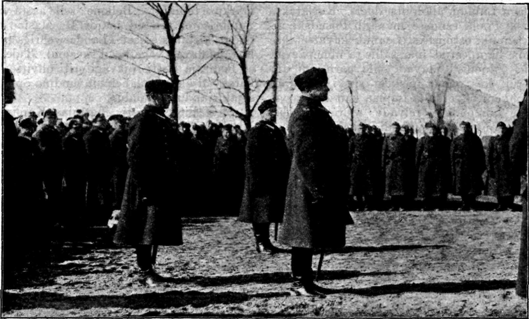
Sõjaministri abi tervituskõne.

nide märklipud. Kuid kasarmute esistel ei ole kedagi. Korruga avanevad nende ukсед ja välja astuvad sõdurid täies relvastuses. Kõlavad koman- dod siin ja seal ja sirgetes ridades marsivad au- samba poole eskadronid ning asenevad kohtadele. Jõuavad ka kohale 2-se diviisi õpekompainii noored. et anda vandetöötust ratsa-rügemendi noortega koos.