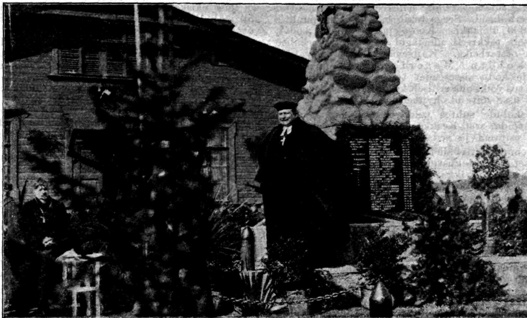
Õpetaja Treumani õnnistuskõne.