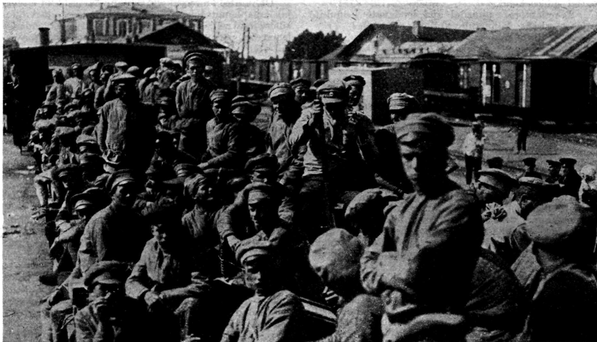
Meie soomusrongide poolt Veški jaama juures vangistatud 200 punaväelast.

arvestus, mis näitab, kuipalju ja missugust kahurväge on vaja antud olukorras jalaväe otsekoheseks toetuseks, kui palju saatjaks ja kui palju jääb üldjuhi käsutusse üldtegevuseks.