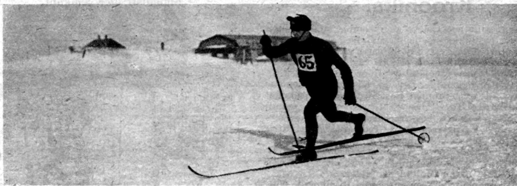
Portupei veltv. Veborn. Sõjakool.