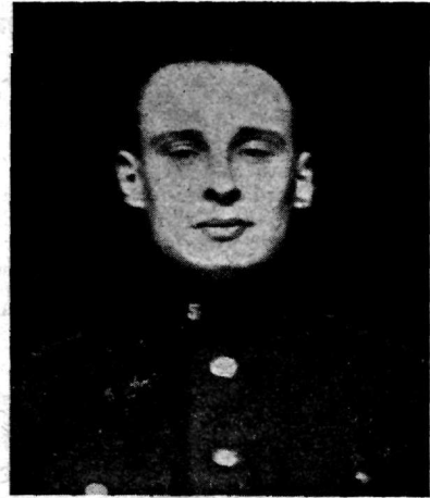
Rms Aleksander Mitt. Sidepat.