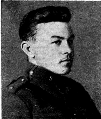
N.-ltm. Lest. Sidepat.

Hoolimata mitte kõigesoodsamast ilmastikust pidas Tallinna garnisoni spordikomisjon lühikese aja jooksul juba teised suusavõistlused 25 km peale. Võistlus oli 20 veebr. Liiva kõrtsi juures, osavõtjaid oli 33. Jooksuteeks oli valitud Valdeki laskeplatsi sihid. Lund oli rohkesti. Võistlused olid kahes klassis. Üldiselt tuleb 25 km suusavõistlust pidada üheks raskemaks võistlusalaks, sest ta nõuab ääretu palju tahtejõudu, vastupidavust, sitkust ja jõudu.