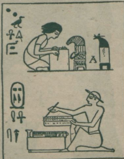
Egiptuse kirjutaja töötamas. Kast kirjutusmaterjali hoidmiseks. Pange tähele lagavara-sulge kirjutaja kõr- va taga.

kindlad selle üle, kuid kord näitas Jumal nende nende vida.