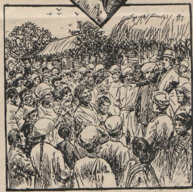
Armüõpetuse kuulutamine mitmel maal.