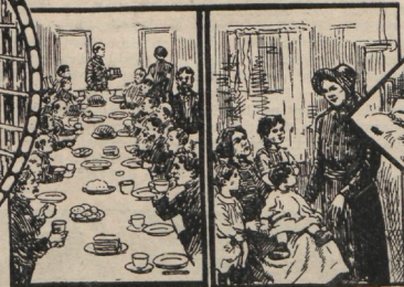
Näljaste söötmine. Puudustkannatajate külastamine.