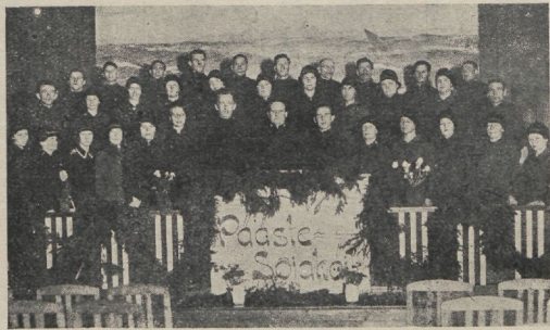
Tallinna 1. uned sõdurid.