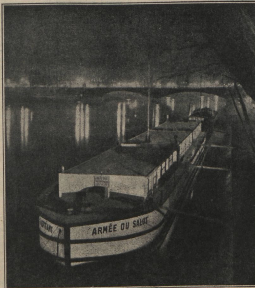
„Asile Flottant“ — Päästearmees asutis Pariisis.