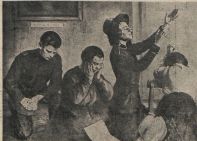
Palvekoosolekult Lätis. (Kunstniku joonistus.)

„Õige inimese vägev palve maksab palju.“ (Jaak. 5:16.)