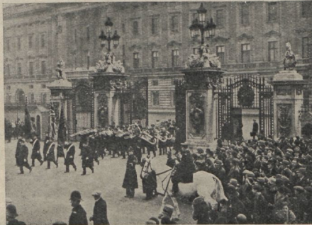
„Regent“ korpusse orkester väljub lossist.

Kui ta astus ruumi, kus istus kuninglik perekond, tulid printsessid Elisabeth ja Margarete Rose talle vastu ja andsid kätt. Kuningas tänas juhti ettekanne eest ja kuninganna ütles mõned lahedad sõnad tänaks