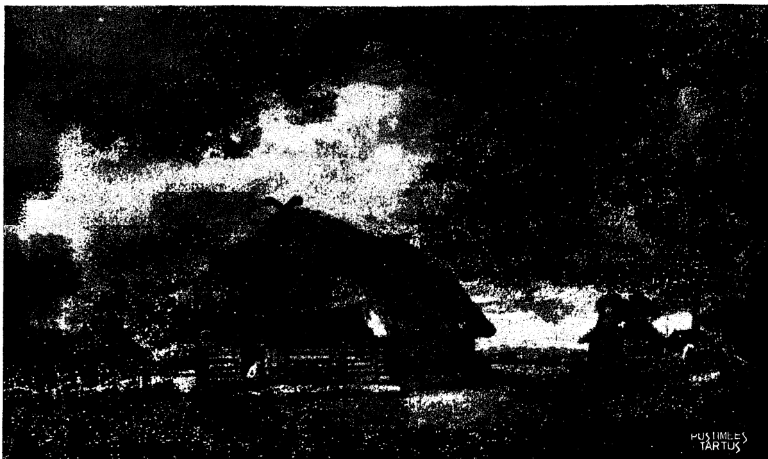
Kunstniku sünnipaik. (1863.a.)