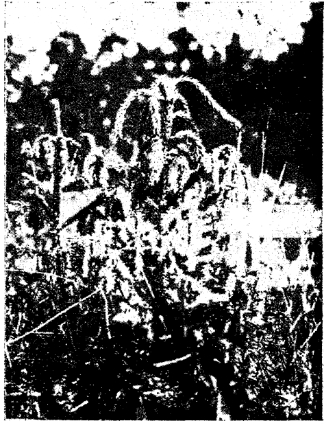
Pilt 2. Kuuse ladvavirved osaliselt rikutud, pahemal terve ladvaga kuusk.

mõju!), viimasel juhul on taimi tihti võimalik varju ja külma veega piserduse tagajärjel (aeglane sulamine!) päästa, mida ka aedades praktiseeritakse.