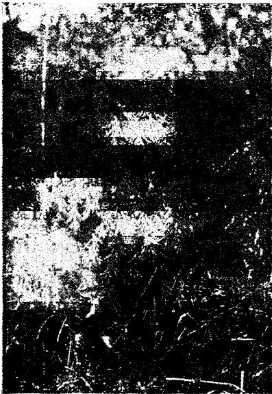
Pilt 1. Külmast täielikult rikutud virvestega kuusk.

kestsid nädalapäevad ja loodus jäi seistama oma arenemises. Aegajalt soojenesid ilmad ja peagi oli väljas kesksuve kuumus, viljapuud löid õitsele, rohi sirgus, puulehed vabanesid päeva jooksul pungadest ja noored kasvud hakkasid sirguma. Maikuu lõpuks tuli vihm ühes suure tormiga, mis õrna lopsakat loodust tublisti piitsutas ja mille jälgi veel praegugi näha võib. Kuid seega polnudki veel lõpp, tulid ka öökülmad ja tegid oma töö, öödel vastu 2. ja 3. juunit langes temperatuur madalamatel kohtadel 2—4° alla nulli. Põhja-Eestis tuli isegi kohati päeval lumekübemeid — täide oli läinud