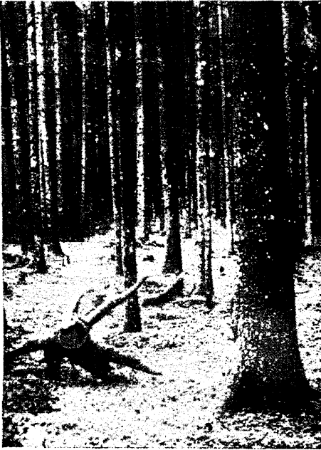
Punamäda haige kuusit endisel põllumaal.

fikutes kõik talweteedärised puud haiged olnud, misjuga mehaanilisi wigastusi olnud saanud. Mäda oli siin tihti wigastatud juurte ja tüve kaudu korruga puusse