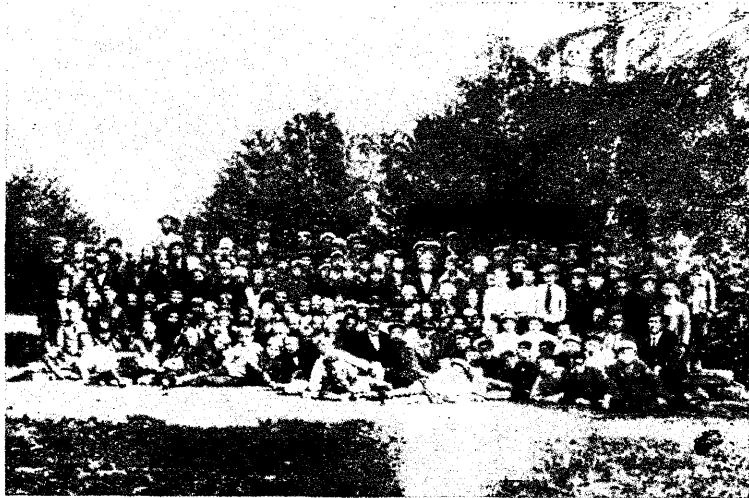
Metsapäev Küti metsandikus Mähka vahtkonnas.

on ju metsad „ostetud“ ja ette on kirjutatud „riiklik järelvalve lõpetada!“). Maareformi teost. määruse alusel omandatud metsad on saatuse hooleks jäetud ja varsti leiata nende asemel (kohati leiata juba nüüd!!) kannustikke — muud mitte midagi! Kahe aasta jooksul müüdud metsadest näit. Kulina asund. Virumaal on läinud „kõige kadumise teed“ vähemalt 50—60%. Tean juhust, kus järgmisel päeval pärast ostu-müügilepingu kinnitamist, algas krundil liiprite tegemine — lugu sünnib krundil, mis asub moräänseljäandikul, milline maa-