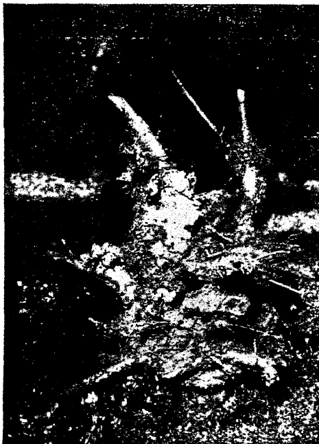
Trametes radiciperda — wiljatehad kuuse juurekawal.

kõige rohkem aga esineb töbi endisel põllumaal kultiveeritud kuusikuis. Kuna wäetis seene lewimist suuresti soodustab, siis tekib punamäda rohkesti ka endisel karjamaal wõrjunud metsades. Samuti aitab seene lewimisele juurel määral kaasa karjatamine kuusemetjades, vähem maapinna wäetamise kui puujuurte wigastamise kaudu loomade läbi. Eriti kahjulikult mõjub karjatamine rammusatel huumusrikastel maadel. Sarnases muldfonnas arenewad kuuse juured pinnapealseteks ja