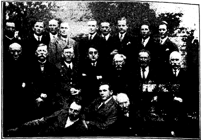
EESTI METSATEENIJATE ÜHINGU TARTU OSAKOND.