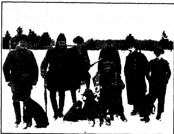
Kui me Nabalas jahil käisime.

ma peaaegu ialgi tervelt ühekorraga ära, vaid tuleb enamasti teisel, kolmandal ööl tagasi jäätiseid koristama. Valgel ööl on teda siis väga soodus lasta. Lava peab aga olema ehitatud puu otsa vähemalt 6 meetrit kõrgele, muidu võib halva paugu järele tiiger küti jalgupidi puu otsast maha rebida, sest tiigri hüpe ülespidi küünib 6 meetrini.