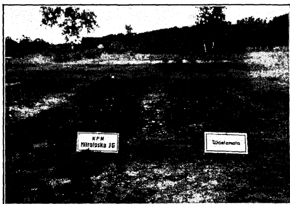
Väetuskatsed Tallinna taimeaias: männikülv 13. mail, vasakuule peenraile antud nitrofoskat 3. VI, ülesvõtte tehtud 24. IX s. a.

3) nitrofoskat ei või segada lubjaga ega lupja sisaldavate väetistega, nagu näiteks toomasjahu.