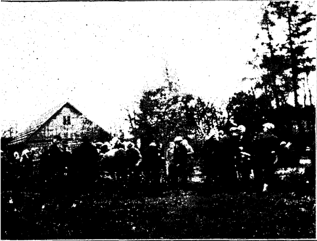
Uue-Vändra Maatulundusklubi poolt korraldatud metsapäev Mälara Liival 28. mail 1933. a.

maikuu numbreid, muidugi rahvale jagamiseks metsapäevadel, kuid ajakirjad ilutsesid mõni kuu hiljem metskonna kantselei nurgas sealse personaali käsutuses. Seetõttu võib järeldada, et ka seesugune viis ei anna soovitavaid tagajärgi. Ja lõppude lõpuks raadio. Ka temast pole suurt kasu, sest suurema osa kuulajaskonnast moodustavad linnad ja alevid kui ka üksikud maa äri- mehed, kooliõpetajad ja teised ametnikud, kes metsanduslikust propagandast on niisama vähe huvitatud kui vasikas kondist.