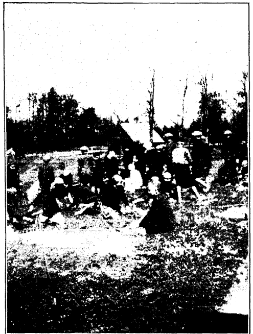
Metsapäeva puhul vabadustammiku istutamine Orajõe metskonnas 19. V 33.

teemi, vaid just propageerimisviisi suhtes. Võib olla, et mõnele paistab eelmine lause veidi imelikuna, kuna propaganda tegemiseks on kasutatud suurimaid pealinna ajalehti, kuukirja „E. Metsa“ ja isegi raadiot, s. o. moodsaimat propagandavahendit. Õige küll. Mul poleks sugugi mõttesse tulnud kõigest sellest nii pikalt pajatada, kui ma poleks näinud, et pealinna ajakirjandust, s. o. seda osa ajakirjandusest, milles tehakse metsanduslikku propagandat, maal õige vähe loetakse ja needki lugejad on kooliõpetajad, ärimehed j. n. e., ühe sõnaga — maata inimesed, kellele pole vaja metsanduslikku propagandat teha. Teine asi on kuukirja „E. Metsa“ga, nimelt saadetakse teda metsapäevadeks metskondadesse ja teistesse kohtadesse rahvale laialilaotamiseks. See iseenesest on veidi parem võte, kuid ka ühe halva lisandusega. Nimelt nägin, et ühte metskonda oli saadetud suurem saadetus kuukirja „E. Metsa“