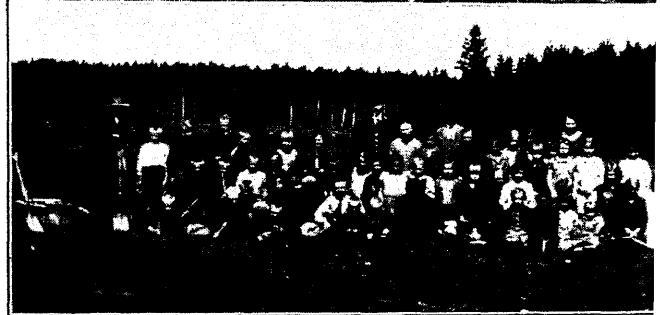
Ülal: Auvere maanaiste selts pärast metsapäeva töö lõppu maikuu 1933. aastal. X märgitud — seltsi esinaine prl. Tamm.