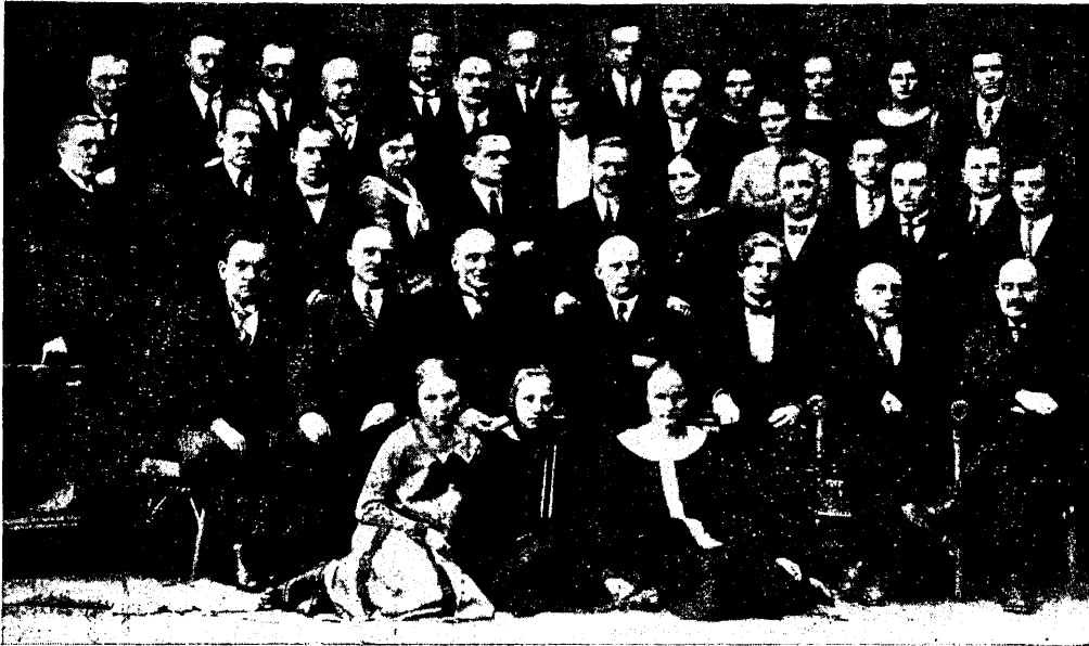
Ühenduse Eüs. «Ühenduse» vilisflaspäev 1. nov. 1925 a.

Peale üliõpilasseltside ja korporatsioonide on tekkinud meil hilisemal ajal veel kolmas üliõpilasorganisatsioonide tüüp, nimelt maakondlised kogud. Viimased on alles lõplikult väljakujunemata, nii et vast vara on nende kohta midagi otsustavat öelda. Näib nagu läheneks nad omas arenemises üliõpilas-