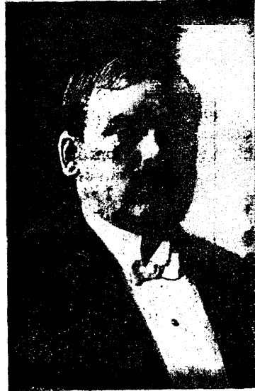
Jüri Vilms. Vilistlaskogu esimees 1913 — surmatunnini.

Peab tunnistama, et „Ühendusel“ kõigi teiste eesti üliõpilaste seltsidega enam-vähem normaal