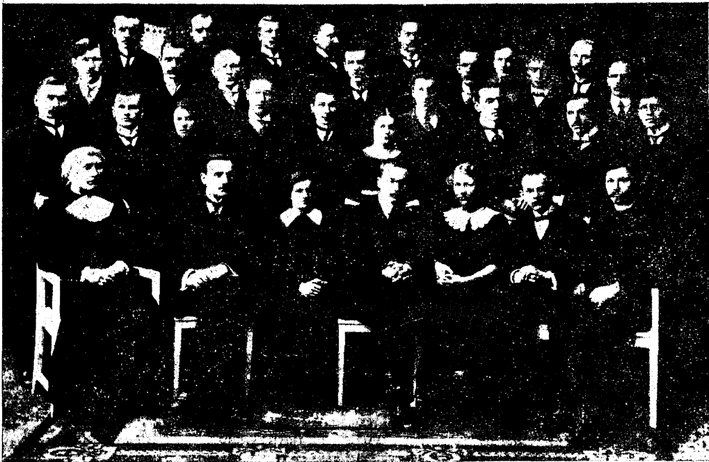
Eüs. «Ühendus» 1912.

See avaldus on seletatav vastoluga, mis alati on valitsenud EÜS-i ja Ühenduse ringkondade vahel revolutsioonilisest liikumisest osa võtmise suhtes. EÜS'i seisukoht on alati olnud, et eestlased kui väikerahvas ei tohi oma jõudu revo-