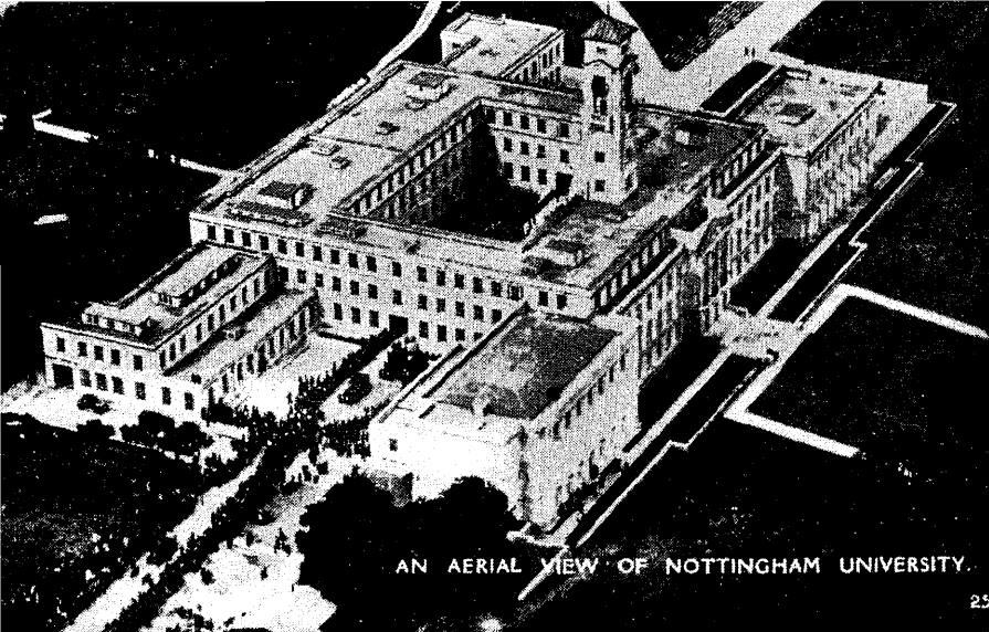
Nottinghami ülikool linnulennult.

tegevuse puhul raamatu „10 aastat üliõpilasreise“ („10 Years of Travel“).