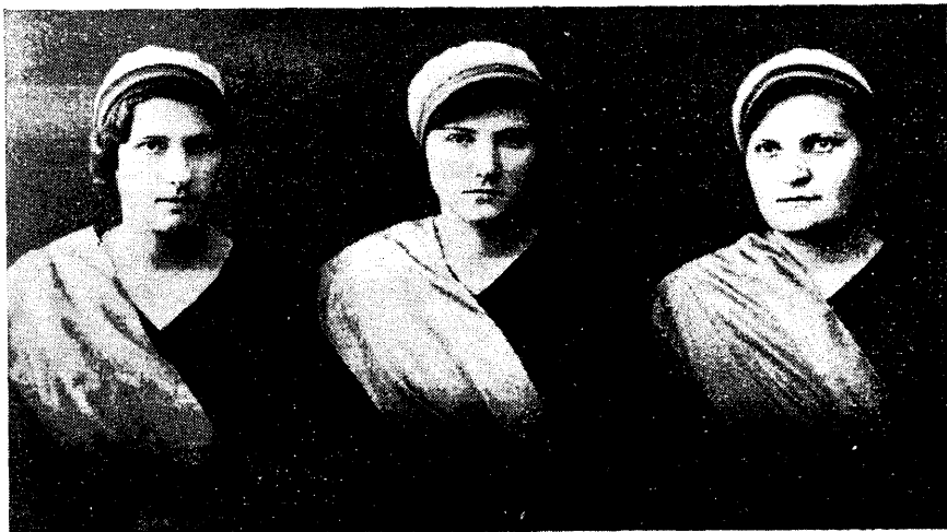
Korp. Lembela presiidium.

ei tohtinud puududa, oli ta orgmata või orgitud. Nood ajad kujundasid naisüliõpilase, eriti naiskorporandi tüübi, milline kahjuks tänapäevani on jäänud püsima nii kirjandusse kui ka ta-