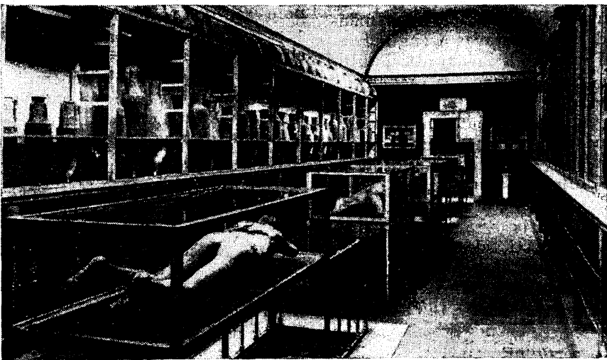
Osa Pompei muuseumist.