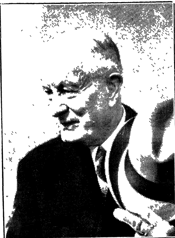
Thomas J. Watson