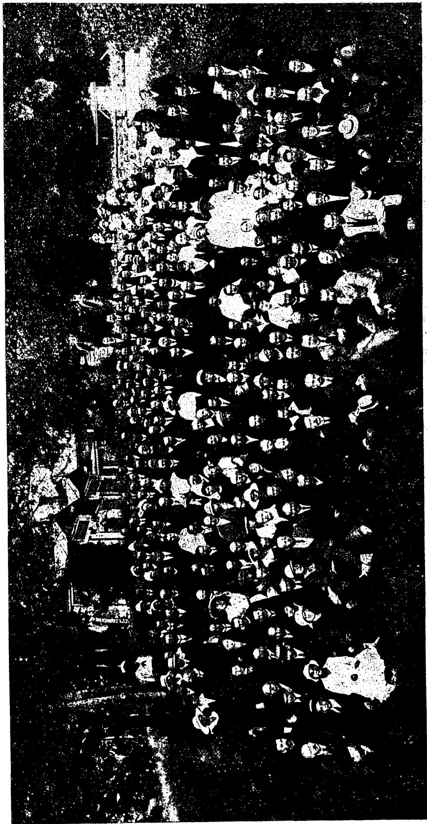
V. üleriiklisest õpetajate kongressist osavõtjad. (16.—18 juunini 1921. a.)