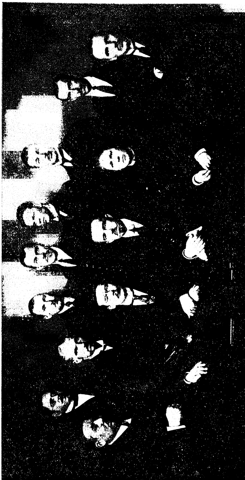
Eesti Õpetajate Liidu juhatus 1922 a.