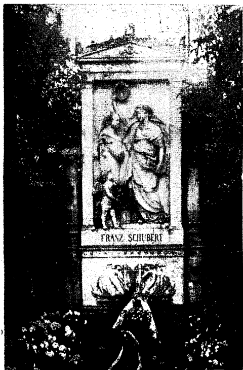
Schubert'i hauasammas Viini keskkalmistul

same me selle loov-vaimu hiiglatöö ees, mis välja kees vaevalt kaheksateistkümne-aastase noormehe hingest, ületades, näiteks, 1815. a. mitmegei teise nimeka helimeistri elutöö hulga. Kui see mitte päris kindel ei oleks, siis ei julgeks üks sulg nende aastate rohket vilja kuidagi paberile panna. Neil viljakail loomisaastail kirjutas Schubert, teenides õpetajana 40 guldnat elatisraha, 4 ooperi ehk laulu-mängu, 144 laulu, 2 sümfooniat, 2 messi, 2 klaverisonaati, klaveritükke, kirikumuusikat ja koorilaule.