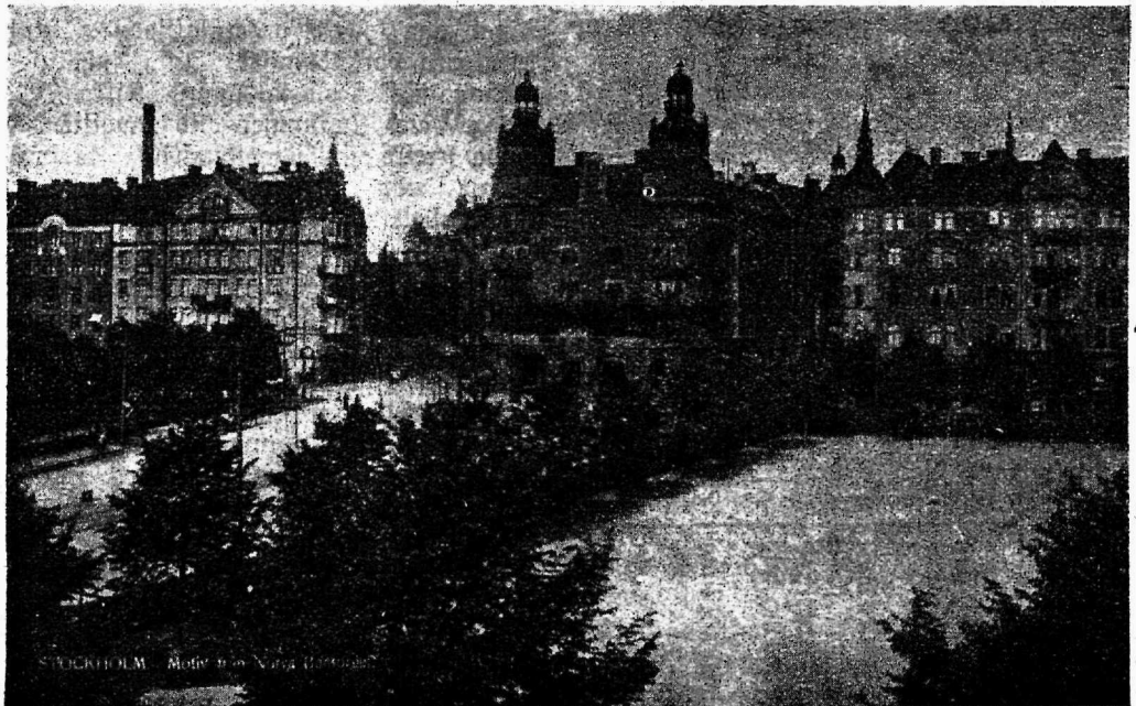
Esimene maja on Rootsi tekstiilistööliste liidu maja, teine ja kolmas Rootsi ametiühenduste keskliidu mis eennujelgi pilooli tujutatud.

Ragu neist andmetest näha on 4 aasta jooksul liigete arv tõusnud üle 100.000. Ülemaadine