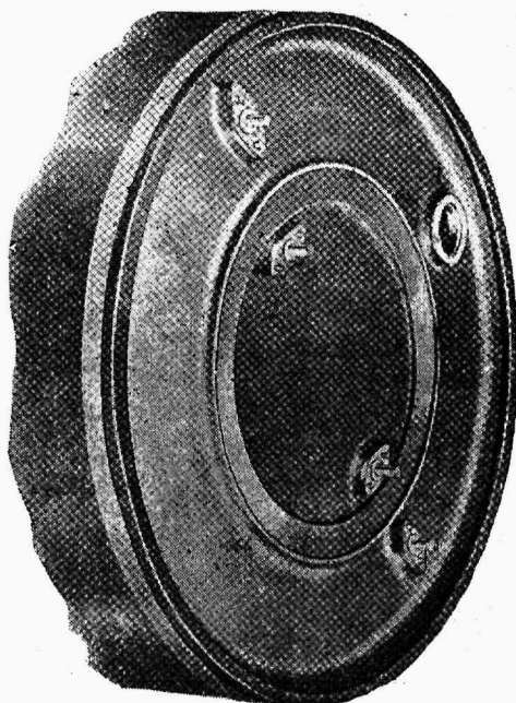
„Zenithi“ või masina välimine ots siliumist.

Sellest metallist on valmistatud võimasinatele metall otsad ja arvatakse,