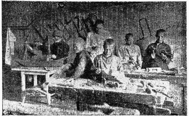
Narwa linna kaswatusmaja kaswandikud puutöötoas.

teeb ministeerium III jsk. töökaitse komisjarile korralduse Rakwere Ühise Haigekassa asutamiseks.