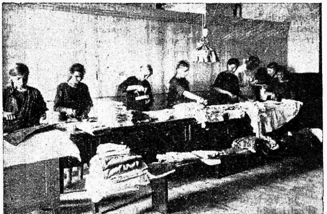
Narwa linna kaswatusmaja tütarlapsed pesu triikimas.

Rinnalaste ja emade kaitset teostab linnade emade ja rinnalaste nõuandekoht. Nõuande kohas töötab üks arst, üks õde ja üks ämmaemand. Õde ja ämmaemand registreerivad eriti waesemate tööliste linnaosades kõik raske- jalgsed emad ja wastsündinud lapsed. Registreeri- tuile annawad õde ja ämmaemand kodus abi, tehes aasia jooksul kuni 3000 wisiiti koju. Kahe nädala tagant toowad emad lapsed nõuande