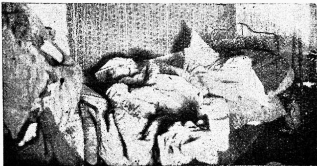
Lahtine hoolekanne Narwas. Waene ja wana naisterahwas omas kodus.

Tänapäew jääb tööpuudus ikka põlewaks küsimuseks, mille wastu wõitlemiseks püütakse kasutada mitmesuguseid wõimalusi, peasjalikult juhuslikke ja wäikeulatuslikke. Küsimuse enam-wähem lõpuliku lahendamiseks pole tahtnud enda pead murda ei wabariigi walitsus, ega tööhoolekande minister, kellele see otsekoheseks ülesandeks. Ministeriumi sammud sellel alal on veel rohkem hädatööd, kui seda on omawalitsuste ettewõttel riigi rahaga korraldatud hädaabitööd töötatöölistele. Ei saa ju ainult