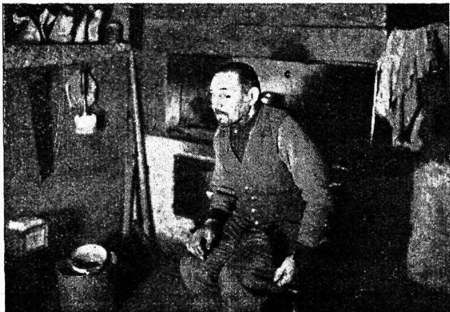
Lahtine hoolekanne Narwas. Abitariwitaja oma kodus.

mise aasta ja kuu“ (kas päew tarwilik ei ole?). Kui siin nõutakse perekonnaliikme sündimise aega, siis ei ole selge, kuhu tuleb paigutada kassaliikme enese wana-dus, ehk ümberpöördult. Tuleb eelistada senini haigekassades maksnud wormi, kus on kassaliikme nime järele lahter „sündimise aeg“, kuna perekonnaliikmete kohta on erilahter pealkirjaga: „Perekonnaliikmete nimed, sündimise aasta, kuu ja päew“. Edasi puudub worm 1-el lahter kassaliikme numברי paigutamiseks. Ka peaks selle wormi joonte ja ridade wahed kitsamad olema, et sinna rohkem nimesid mahuks, nii et näiteks turbatöös-tus oma tööd algades ei pruugiks üht-sada isikut sisse kirjutades kümmet blanki tarwitada, waid wiie ehk wähe-ma arwu