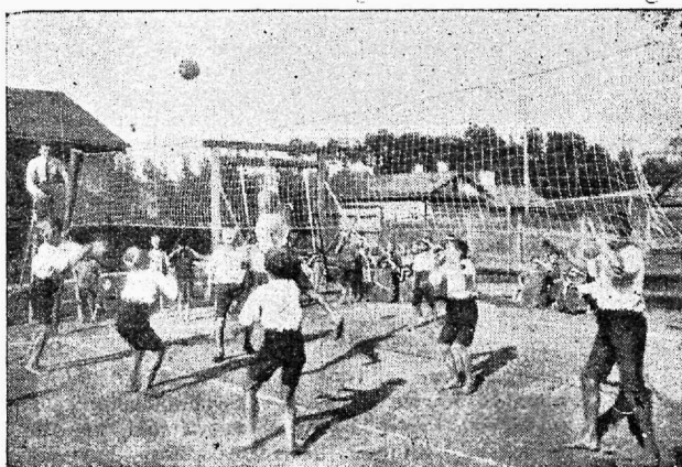
Narwa linna kasvatustamaja kaswandikud palli mängimas.

kohta arstile läbiwaatamiseks. Waesematele emadele antakse nõuande kohast nõrgemate laste toitumiseks lisa-toiduaineid: mannat, riisi, herkuleid, suhkrut, kakaod, piima, kalaraswa jne., kui ka lasteriideid.