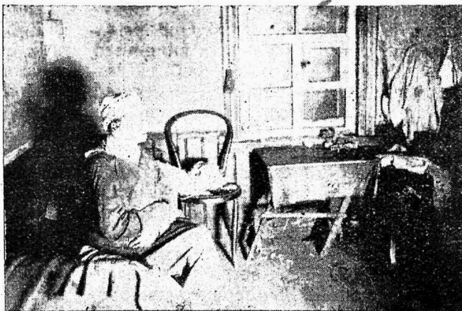
Lahfine hoolekanne Narwas. Abitarwitaja omas kodus.

Kinnitusnõukogu töö tulemusena kuulutati 15. juunil 1926. a. ilmunud „Riigi Teatajas“ Nr. 52 „määrus tööstuslise töö seadustiku III. pektüki alla kuuluwate