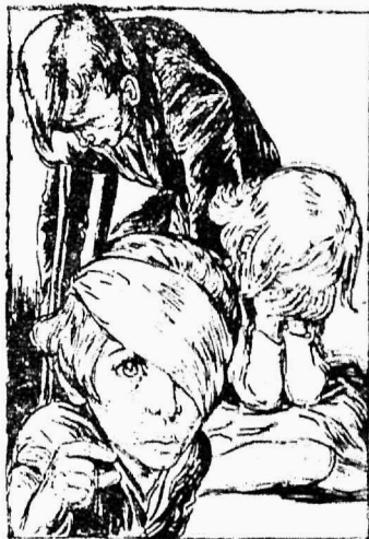
Metsikult peksetud lapsed.

Montagne ütleb, et kasvatuses tuleb välja heita vägivald ja toorus, et kool ei muutuks türmi, kus lapsi ära rikutakse, neid karistades veel enne, kui nad rikutud on. Nii ei tohi olla, kui kool tahab kasvatada tugevaid inimesi, aga mitte härgi, kes sõnakuulelikult painutavad ikke alla. Kooli ei tule kaunistada vitsakimbuga, vaid lilledega ja puulehtiga,