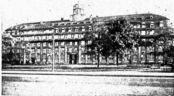
Dresdeni haigekassa hoone.

Varematel aegadel, kus töölised ei olnud veel tugevalt organiseeritud, aga ka käesoleval ajal neis mais, kus tööliste ühisjõud veel nork, on püüdnud töölised toetust korraldada vastastikuse abiandmise läbi, selleks luues vastavaid kassasid. Kuid see viis ei rahuldanud töölisi. Kõik töölised ei saanud olla kassaliikmeiks juba kõrge liikmemaksu