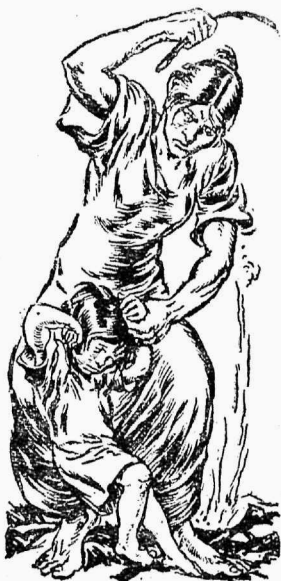
Ära peksta last!

Mitmel korral on kõlanud riigikogus hääli, kes nõudsid — lubatagu lapsi koolis peksta, nagu seda tehti varem. Nüüd on nad saanud esimesi tagajärgi. Vangistusseadusesse võeti paragrahv, mis lubab ihunuhtlust lastele, kes kohtu otsusel paigutatud parandusmajja. Siit loetakse välja, et — Eestis hakatakse jällegi tarvitama ka koolides ihunuhtlust, nagu seda õpetab vana testamendi barbaarne tarkus, mille järgi vanemate armastus avaldub valusates viitsades.