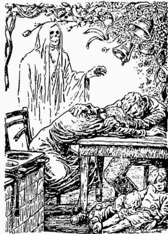
Tööpuuduselont valvab töölis perekonda „Das kleine Blatt“

del vaheaegadel, samuti ajuti poolikud töönädalad.