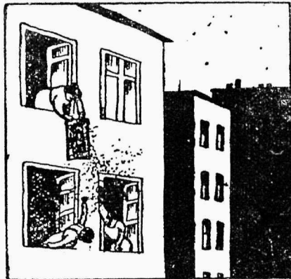
Tolm ja pisilased ühest aknast välja ja teistest sisse.

Täiuslikuks ei saa homo sapiensi põlve mitte ennem tunnistada, kuni mitte oma inim-lapse sünnitamiseks talle pole antud zeuslik, jumalik võim!