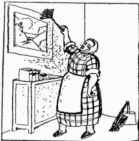
Nii külvatakse pisilasi.

Enne tolmutatakse tolm ja pisilased seintelt lendu. . .