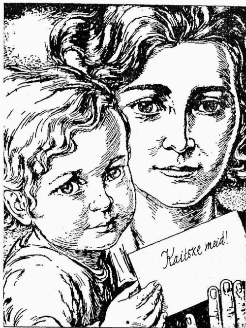
F. Plachy. (Das Kleine Blatt). Emaj ja laps.

Kui nüüd võrrelda Eestit rinnalaste surevuse suhtes, siis saame järgmised andmed. Nii suri lapsi alla 1 aasta: