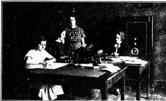
Pärnu Ühishaigekassa kantseleiruum ühes ametnikega 1936. aastal.

c) mitte suitsetada ruumides, kus on rahvast, eriti mitte seal, kus on lapsi;