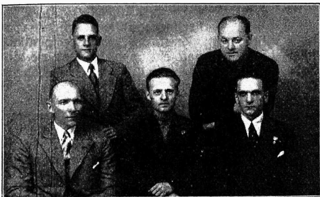
Pärnu Ühishaigekassa juhatus 1936. a.

Pagarite öötöö keeldu on peetud siiski nii tähtsaks, et seda kaaluti rahvusvahelises ulatuses. Rahvasteliidu töökongressidel, kus küsimus otsustati, oli osavõtjast \frac{1}{3} valitsuste, \frac{1}{3} töös-turite ja \frac{1}{3} tööliste esindajaid kõigist