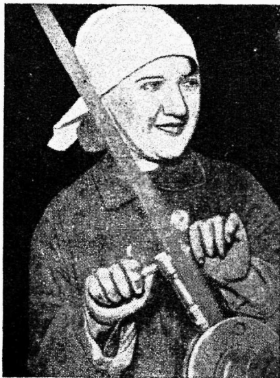
Naistööline N. Liidus

nõukogude koduarstiks, perekonna ja lapse lähimaks sõbraks, kandes perekonda ja lasteasutusse tervishoiukultuuri.