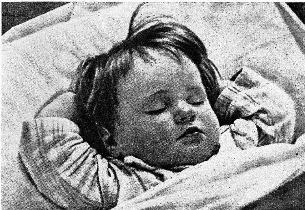
Uinu laps NSVL-u lastekodus

kusele on saanud seaduseks Stalini Konstitutsiooniga.