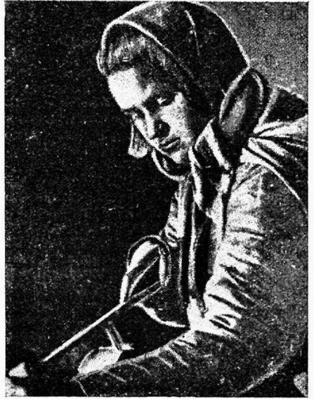
Metallivabriku naistöölaine N. Liidus

Sõda valgete soomlastega näitas selgesti, kui suuri tagajärgi saavutatakse sotsialistliku ühiskonna tingimustes. Epideemia-vastase organisatsiooni suur