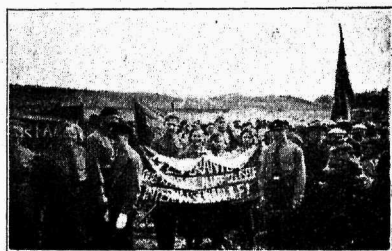
Võimlusrühmad, noorsotsialistid ja noorvalburid maimiitingul

Mäss aparadi vastu, mehhanismi vastu on iga noore generatsiooni ülesanne; muidugi, iga riiki, iga omavalitsust, iga parteid peab valitsetama. Inimesed, kelle funktsiooniks on valitsemine, peavad olema korralikud ja pedantsed, peavad olema umbusklikud kõigele, mis võiks häirida reeglipärasat käiku; aga noorpõlvele see teeb vähe muret, valitseva ja säilitava aparadi mured on talle kauged, peavad olema talle kauged. Häda noorpõlvele, kes on rahul olukorraga, kellele kõik ei näi liig pikalisena, liig lohisevana, kellele saavutatu ei ole liig vähe! Häda noorpõlvele, kes ei ole