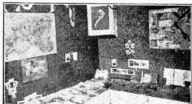
Näitus : Marx'i nurk