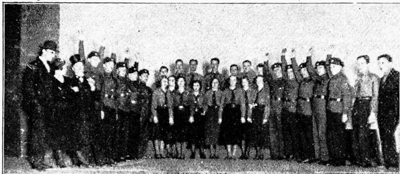
Kõnekoor „Karl Marx ja meie“

sms Oskar Pärn Liidu tegevuse aruandega, kes näitab arvulisil andmeil, et Liidu tööviljakus on kasvand ja töö ise muutund stabiilsemaks. Tegevuse ja rahaline aruanne kinnitatakse.