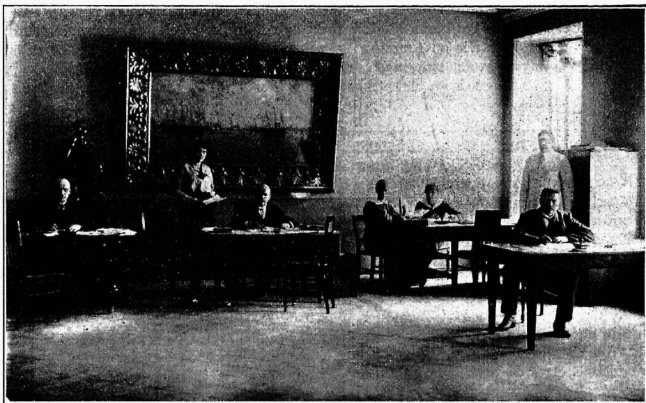
Eesti Punaseristi kantselei.

Sarnane kaupade wahetuse systemi tarwitusel ei kautaks Eesti oma rahwuse warandusest, sest Eesti produktide müümisel tõuseks kredit wäliswaluutas, mille eest tarwilikusi kaupasi wõiks wäljamaalt osta. Kahjuks ei leia mina Eesti kaubanduses seesugust systemi tarwitusel, ja nagu statistika näitab, on Eesti oma kaupade eest Wenemaal, Inglismaal ja teistes riikides Eesti markades makstud saanud, kuna aga kaupade sissewedu wäliswaluutas õiendakse. Selle tõttu kautab Eesti palju oma