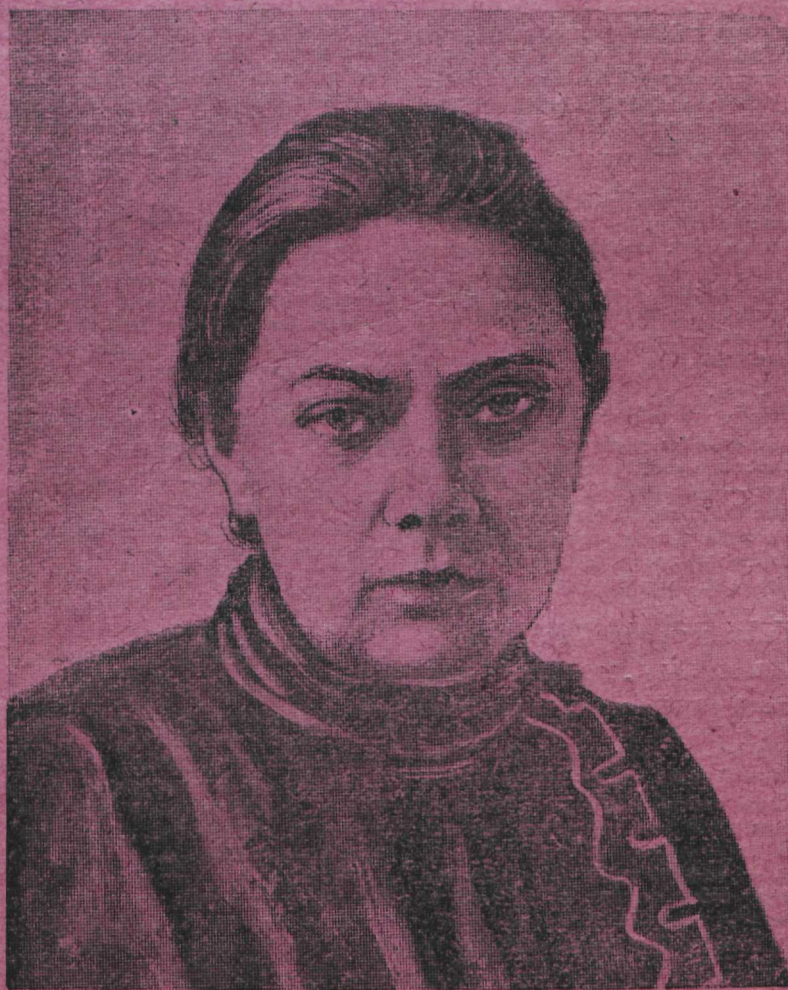
NADESHDA KONSTANTHOWNA KRUPSKAJA