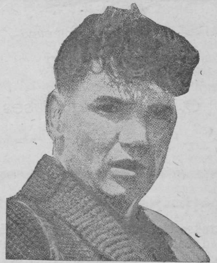
Jack Dempsey võtab naist.