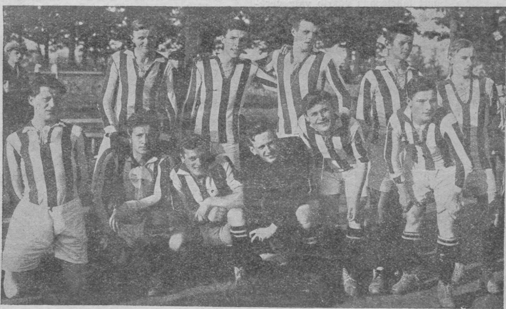
Kovas — Leedu 1924. ja 1925. a. meistermeeskond.

Võistlus algab Läti hoogsate ja kenade läbimurretega. Shansse on E. Bardal, Taurinshil, uuesti Bardal ja Timpersil, kuid Stashinskas