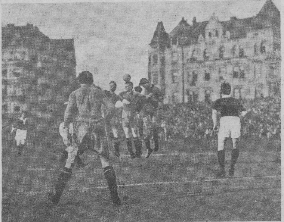
Võistluselt Praagas Sparta — Vienna 1:1.

— Ungari väravavahtidest on mitmed paremad, nagu teisedki Ungari jalgpallimehed, laiali mõõda Euroopat. Nii on Plattko juba pikemat aega F. C. Barcelona väravahoidjaks, kuna teine kuulus Ungari väravavaht Feher praegu Itaalias on.