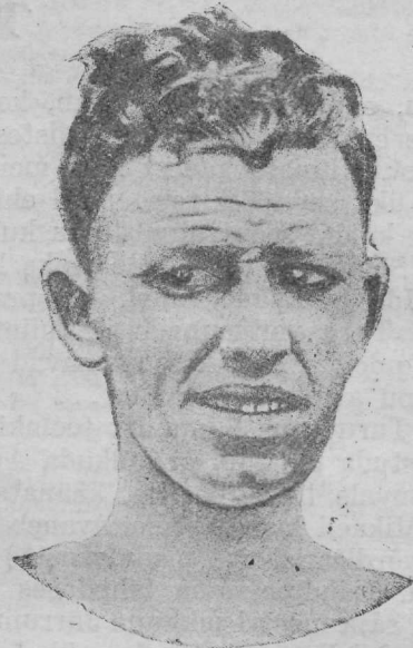
John C. Miles,

20-aastane kanaadlane, kes Bostoni maratonis purustas Hannes Kolehmaise maratonijooksu ilmarekordi ajaga 2 tundi 29 minutit 40,2 sekundi. Ta lõi samal jooksul ka Pariisi olümpiavõitjat Albin Stenroosi nelja minutiga.