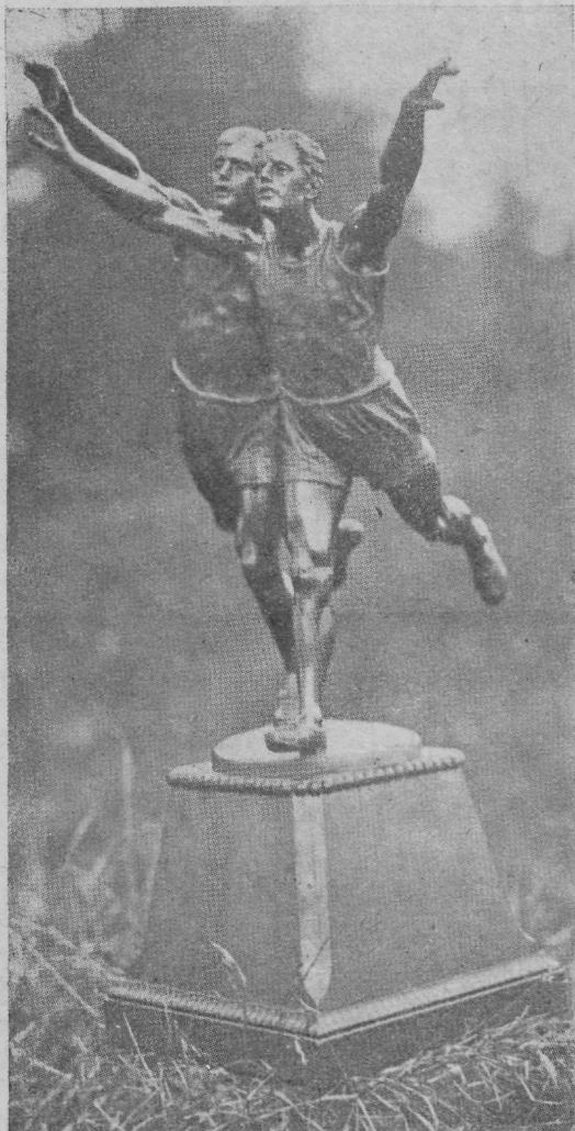
Väikeseltside tsükli auhind, mille Merkur võitis.

17. mail alanud Tallinna väikeseltside kolmandate karikavõistluste eelringile, mis möödus võrdlemisi kiirelt, järgnes pikk paus. Veeres rida päevi, päevadest said nädalad ja alles juunikuul 12-al päeval peeti karikavõistluste tsükli esimene poolfinaal. Vastamisi sel kauaoodatud võistlusel, mis peeti ühel kõledal külmal pühapäeval Spordi väljal, seisid