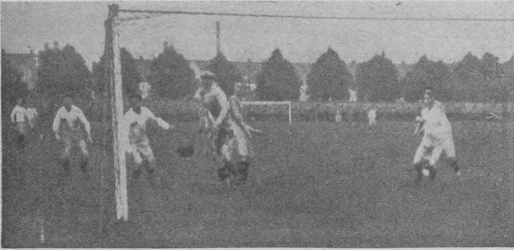
Moment esimesest poolajast. Tipnerist mööda löödud palli jõuab kiirel jooksul tõrjuda paremal pool näha olev Kaljot. Tipneri kõrval Tore Keller.