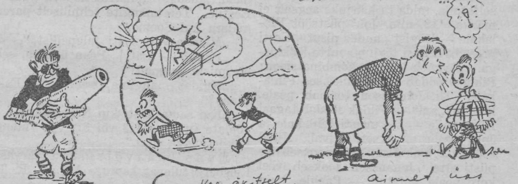
Siin saavutavad, kes eestlastel on mõitruksalt paremsõnise mine