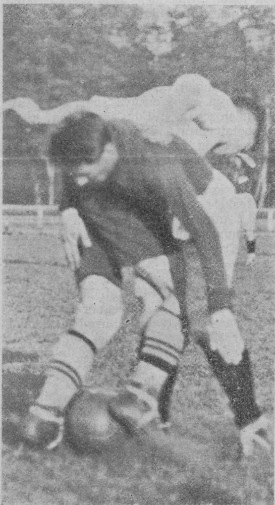
Vabamaadlus palli pärast.

Eesti oma järgneb. Hümide mõjul tõusevad pealtvaatajad päid paljastades. Kell 7.05 võtab marss kohtunikku-trio McKibbin — R. Anier — Paalbergi vastu. Lätlastel veab jälle poole valikuga alla päikest.