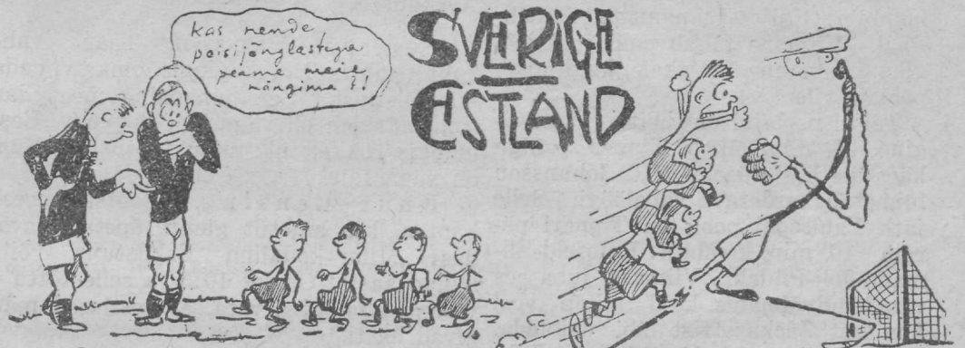
Rootsi durivi ei ole kõige väikese kasvulise, mis Rootsi eest mänginud

1. 7. 27. Norrköpingi Idrottspark. 5134 vaatajat. Rootsi kuningakoja esitajana kohal H. K. H. prints Carl j:r.