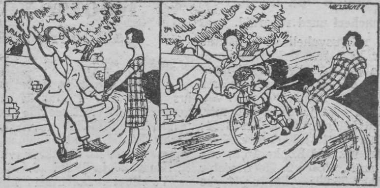
Saatus rattasõitja kujul.

Peale töölisspordi võistlusi peeti 29. augustil koosolek, millel vaheldase osavõtu juures otsustati asutada Eesti töölisspordi liit. Selles ei ole mingit uut sisu ega vormi, vaid vesine järelaimamine Lätil ja Soomele, kus n. n. töölisspordi liidud asutatud mõni aasta varemalt. Uue liidu halbtus on see, et seal ei ole mitte