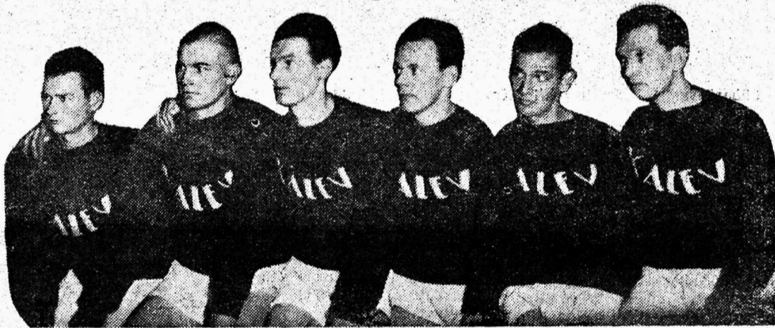
Eesti korvpalli meistermeskond Tallinna Kalev.

Võistlusõhtu tildpilt jäi nagu veidi kesiseks. Kalev võitis kõik mängud kindlasti, kuid väga napilt. See vast oli ainuke huvitõstja esivõistluse finaaliidel. GPU.