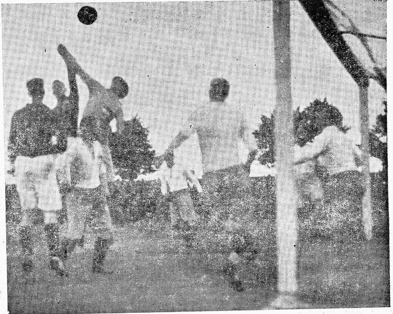
Saatuslik silmapilk: Tt. geb ps. Einmani käele, millega

Maruline joovastus: Mütsid lendavad õhku. Siit peale on uus lehekülg mängus. Läti surve muutub üha võimsamaks. 24. min. kaugele löök väravale. Tipner püüab, kuid lasab