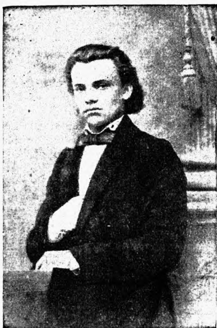
C. R. Jakobson Torshavn (19 a.)

narist saadud teadmisi ja uueaegseid pedagoogilisi vaateid täiendas ta hoolsa eneseharimisega neil ja muudel aladel. Iseäranis Peterburi ajajärk oli talle tähtsaks poliitiliseks kooliks. Sääli tutvus ta vene kõrgemate ringkondadega ning poliitilise võitluse vahendite ja viisidega. Nii kujunes Jakobsoni platvorm ja programm sammsammult ja järjekindlalt. J. kaastöö „E. Postimehes“ 60-ndate aastate lõpul näitab, et ta töökava ja taktikagi juba siis õige täielikult olid välja kujunenud.