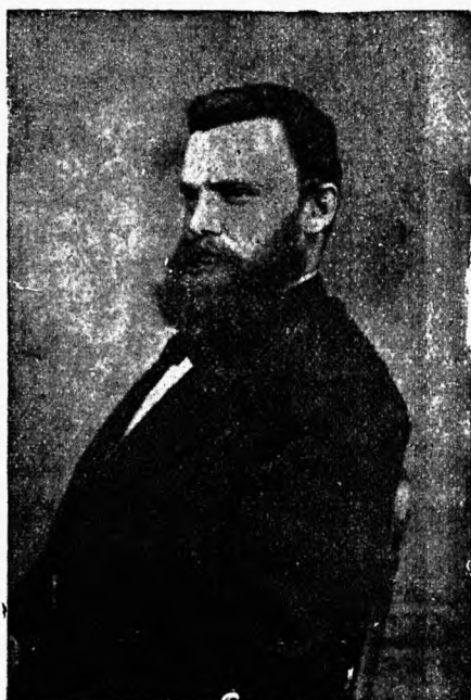
C. R. Jakobson Peterburis.

jalikult mõisnikkude ja muude kodumaa küsimustega. Et paremini mõista talurahva vajadusi ja elutingimusi hakkas ta ise tegelikult põllumeheks. Jakobsoni reforminõuded olid suunatud peamiselt kolmele alale: poliitilisele, majanduslikule ja hariduslikule. Eestlastele oli vaja suuremaid poliitilisi õigusi. Aleksander II reformide antud õigused, mis kaasaegseid rahuldasiid, olid õige kiiresti muutunud kitsaiks, mis ei võimaldand rahvale täit elu ega arengut. Päälegi oli